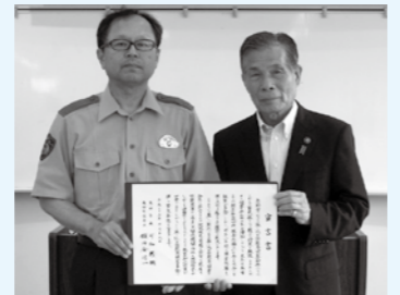
▲署長と市長が宣言書に署名

このため7月19日には、恵那警察署で振り込め詐欺等被害多発に伴う緊急対策会議を開き「振り込め詐欺等多発に伴う緊急事態」を宣言しました。