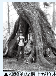
▲神秘的な根上がり木

□とき ▽アライダシ原生林散策Ⅱ9月1日(日)、10月8日(火)、20日(日)、11月3日(日)、17日(日) ▽大船山・松並木散策Ⅱ10月13日(日)