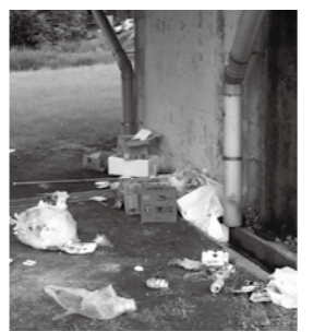
▲阿木川公園(大井町)に放置されたごみ

公園は、多くの方が利用します。禁止行為は行わず、ペットのふんやごみは持ち帰り、喫煙は遠慮するなど、マナーを守りましょう。