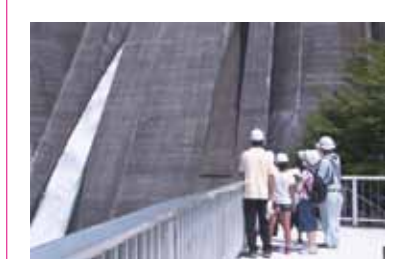
▲なるほどがいっぱい! ダムツアー

● 成人式を一堂に放送 市内全域統一開催となった平成23年から平成25年の成人式を放送します。