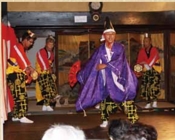
優雅で、ときに滑稽な歌と踊りが 15 分ほど続く

大井町岡瀬沢地区の氏神の富士浅間神社に伝わる伝統芸能。御殿万歳の流れをくみ、1931(昭和6)年夏の例大祭で初めて奉納された。住民の無病息災と家内安全、五穀豊穡を祈願し、青年団が中心となり伝承してきたが、1963(昭和38)年に青年団の解散で休止に至った。しかし、20年後の1983(昭和58)年に地元で保存会を結成し復活。翌年には子ども万歳も始まり、市無形民俗文化財に指定された。