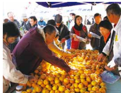
▲ 11月に開催された笠置町ゆず祭り

【市長】 笠置町は、ゆず祭りを開催しており、ユズを地域の特産品にしようという意識がすごく強いんです。地域がユズでまとまり、特産品を作り出そうと、まんじゅうやようかん、ドレッシングなどユズを使ったあらゆる試作品を作りました。地域が一つになり、取り組んできたことが順