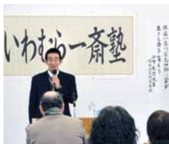
▲一斎の思想を講義

□とき 1月19日(日)午前10時(午前8時半受け付け) □ところ 大井第二小学校 【大井町体育連盟(西本) ☎25-4850】 【新春三郷町民走ろう歩こう会】 □とき 1月26日(日)午前10時(午前9時受け付け) □ところ 野井トレーニン