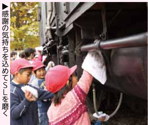
▲感謝の気持ちを込めてSLを磨く

SLは、シートで覆って保管されていますが、明知鉄道では、今後SLの車庫を整備し、将来は、明智駅構内で動かすことを目指しています。