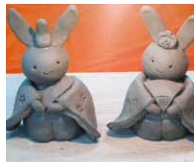
▲かわいらしいウサギのおひなさま