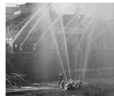
▲阿木川で行われる一斉放水

新春恒例の市消防出初式を1月5日(日)に開催します。 勇壮な恵那トビはしご登りや分列行進、全消防団による一斉放水が行われます。お誘い合わせの上、見学ください。 □時間・ところ ▽式典 午前8時・恵那文化センター ▽分列行進 午前10時半・恵那駅前中央通り ▽恵那トビはしご登り 午前10時45分・駅前中央通り ▽一斉放水 午前11時15分・阿木川(大井橋・佐渡橋間) □交通規制 午前10時～11時