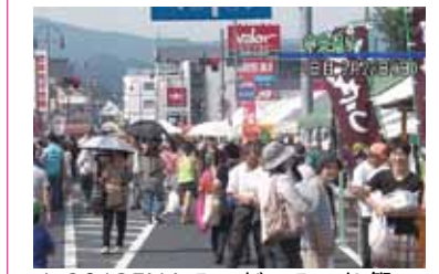
▲2013ENA みのりのみのり祭

● コミュニティ番組の再放送 市内のイベントなどを編集したコミュニティ番組。年始の3日間は、平成25年に放送した番組の中から再放送します。