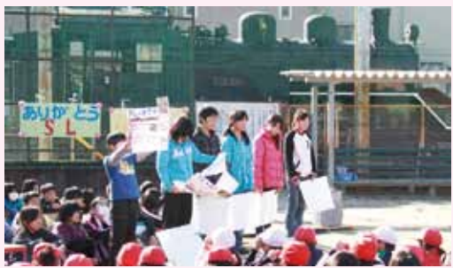
▲SLの前で勉強したことを発表