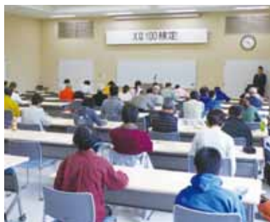
▲56人が挑んだ「えな100検定」

「えな100検定」の受験者は昨年の34人から、ことは56人に増加しました。そのうち、小学生は9人でした。大井第二小学校では「えな100選」を4年生の社会の授業で使用し、市の名産や事業を学習しています。このような取り組みが受