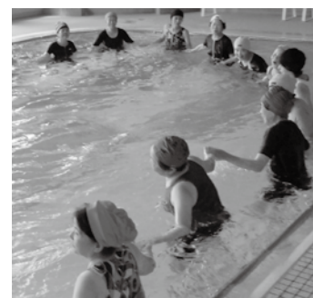
▲水中で手をつなぎ横に歩く運動