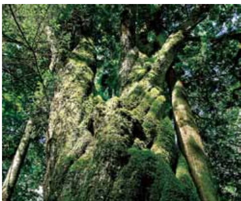
▲アライダシ自然観察教育林の原生林

ります。たくさんある魅力を宣伝して、訪れてみたくなるようにしたいと思っています。人が集まる所には、必ず活力が生まれるため、交流人口を増やせば、市は活性化します。今後、市の人口は減っていきませんが、交流人口が増えれば、元気になれると思います。いろんな観光資源をうまく磨き上げて、皆さんに興味を持って来てもらえる仕組みが大事です。