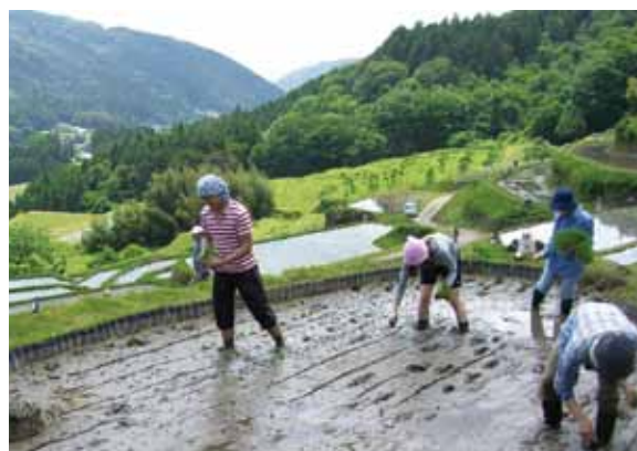
▲ 坂折棚田で行われている田植え体験

棚田で田植え体験をしながら、泊まって収穫物を食べるなど、滞在型になればいいと思います。市内で滞留するか再び来てもらえるように