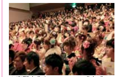
▲恵那文化センターでの成人式

● 成人式を一堂に放送 市内全域統一開催となった平成23年から平成25年の成人式を放送します。