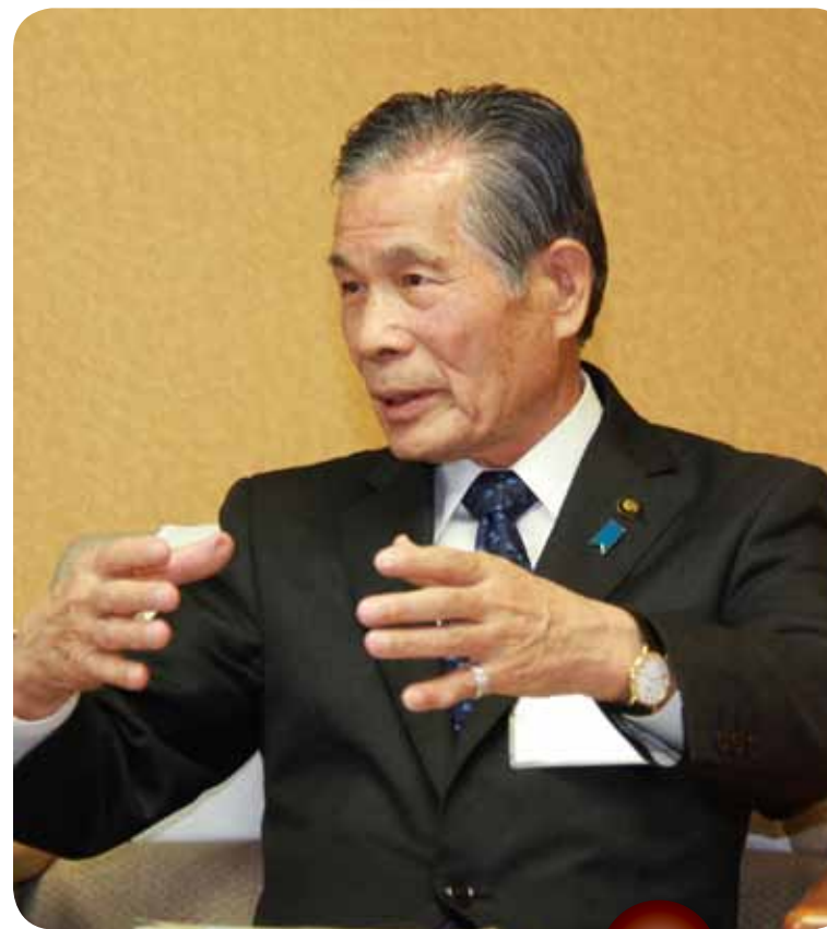
かちよしあき 恵那市長 可知義明