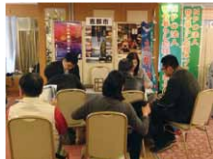
▲都市部で移住定住の相談会を開催

答 市では、総合計画の後期計画(平成22年から27年度)の重点課題として、人口減少対策事業を考える五つのプロジェクトを進めています。①少子化対策②若者の結婚支援、仕事と家庭の両立支援③健康・寿命延伸対策④健康出前講座、高齢者の福祉活動、起業支援⑤魅力づくり