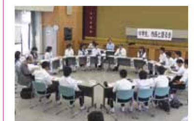
▲中学生、市長と語る会