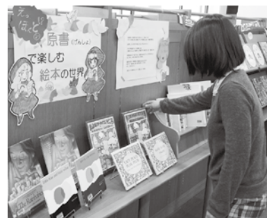
▲雰囲気違う外国語の原書

※1日(水)～3日(金)は年始、4日(土)、30日(木)は図書整理のため、14日(火)、15日(水)は祝日振替のため休館