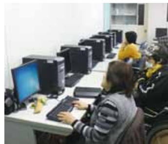
▲パソコン操作を丁寧に説明

パソコン教室を通して、社会参加しませんか。見学も大歓迎ですので気軽に申し込みください。 □ところ・とき ▽市福祉センター ☎1月29日、2月5日、19日(水曜日) 午前10時～正午、午後1時～3時 ▽岩村福祉センター ☎