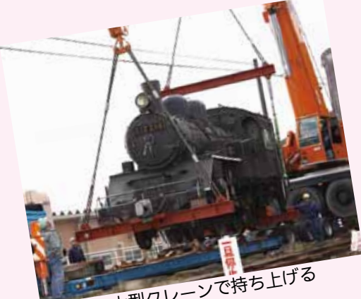
▲2台の大型クレーンで持ち上げる