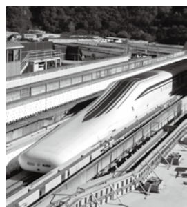
▲実験線を走るリニア中央新幹線の車両

これを受け、県の条例に基づき公聴会が開催されます。見解書はJR東海のウェブサイト（http://jr-central.co.jp）