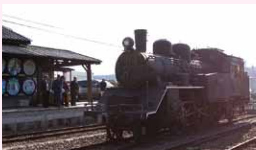
▲明智駅でレールに乗った姿を披露