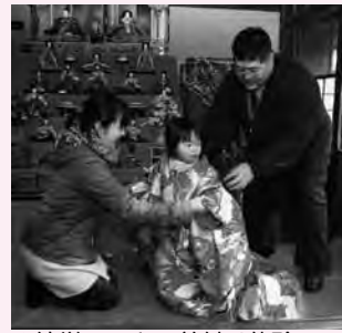
▲簡単にできる着付け体験

□主な催し ▽3月2日(日) Ⅱ オープニングイベント (午前9時～)、ひなのクラフトフェア (午前10時～)、恵那・岩村まちなか市 (午前9時～)、簡単着付け体験 (午後2時～4時半)