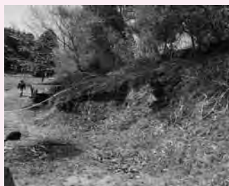
▲油断で火災になった所