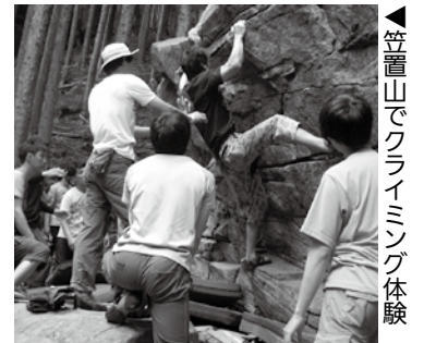
▲笠置山でクライミング体験