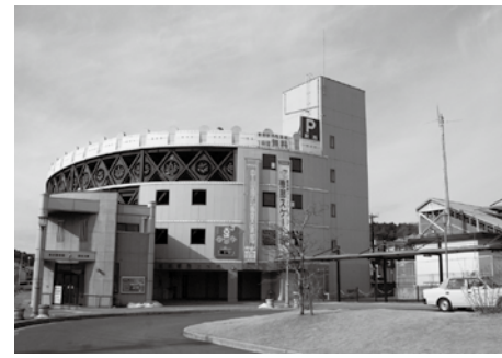
▲恵那駅に隣接し便利な駅西駐車場

▽原動機付自転車、二輪車 無料(ただし登録が必要) □申し込み方法 恵那駅西駐車場に備え付けの申込用紙に記入の上、必要書類を添付して申し込み(申込用紙は2月23日(日)から配布します) □受付期間 3月1日(土)～15日(土)(先着順) 申・問 恵那駅西駐車場 26-5211