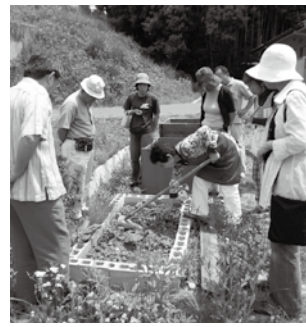
▲ブロック処理を学ぶ

ふれあいエコプラザの3月の環境講座では、EMぼかしとバケツを使って誰でも簡単にできる生ごみ処理や、狭い土地で生ごみを堆肥化するプ