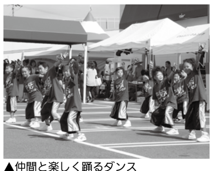
▲仲間と楽しく踊るダンス

□日にち 4月8日(火)、22日 □ところ 恵那文化センター □対象・時間 ▽チャ・リズムクラス(年長・小学1年生女子) ☎午後4時～4時40分 ▽ミクロキッズクラス(小学1・2年生) ☎午後4時40分～5時25分 ▽キッズクラス(小学3～5年生) ☎午後5時25分～6時10分 ▽ジュニアクラス(小学6年生以上) ☎午後6時10分～6時55分 □料金 ▽受講料 ☎11000円(月2回) ▽見学 ☎無料 ▽体験受講料 ☎5000円/回 □定員 各30人(定員になり次第締め切り)