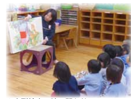
▲大型絵本の読み聞かせ