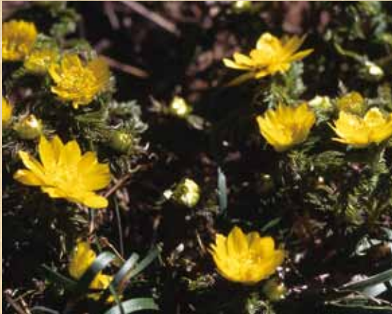
かれんな花を咲かせるフクジュソウ

上矢作町の中心部から5キロほど上った谷間に達原大平地区 たつばらおおだいら がある。この集落の裏山は、ヒノキとスギの林になっていて、フクジュソウは、この裏山に続く小道のほとりから田畑の斜面にかけて、約40センチにわたり、足の踏み場もないほどびっしりと咲く。