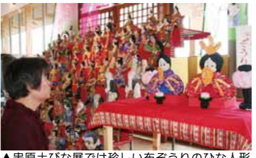
▲申原土びな展では珍しい布ぞうりのひな人形も展示

中山道大井塾では、つるしびな約100本や手作りひな約150体など、市民の皆さんが趣味や陶芸教室で作ったひな人形を展示します。