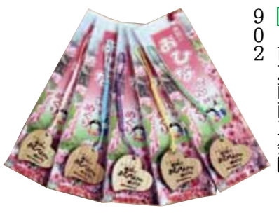
▲贈呈されるストラップのひなは5種類の色

全部で5000体を超える土びなとひな人形に会いに来ませんか。また岩村町、山岡町、明智町、串原、上矢作町の5会場でスタンプを集めて