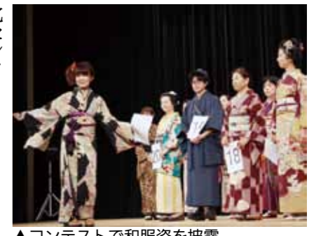
▲コンテストで和服姿を披露

□期間 4月3日(木)まで ※「いわむら城下町のひなまつり」は本紙2月15日(日)13頁、「大正村おひなまつり」は本紙10頁をご覧ください