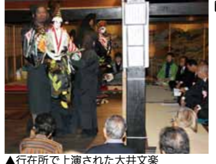
▲行在所で上演された大井文楽