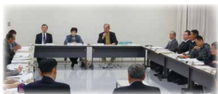
▲保護者代表らが子育て支援事業を議論

●子ども・子育て会議を設置 市では、昨年10月に保護者の代表や地域の代表、民間の子育て支援従事者、学識経験者で構成する「子ども・子育て会議」を設置しました。会議では、市民の意見を聞きながら、子育てをめぐる現状と課題の分析や課題の解決に向けた方針を議論しています。