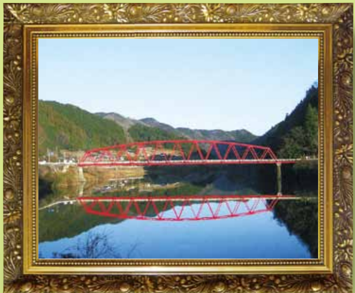
笠置ダム湖に写る武並橋

冬の澄み切った空の日、朱色の武並橋が夕日に映えて笠置ダム湖に写り、対称的な美しい光景が見られます。