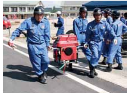
▲非常時に備え訓練に励む消防団員

慢性腎臓病(CKD)は、腎臓の働きの慢性的な低下や、たんばく尿が出るなど、腎臓の異常が3カ月以上続く状態です。国内では、成人の8人に1人が慢性腎臓病だろうと推測されています。