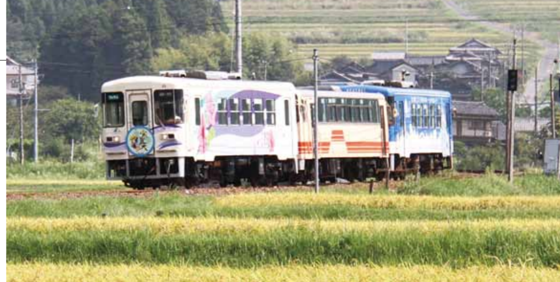
▲明知鉄道は公共交通の基幹路線として機能強化し新たな魅力の創出を目指す

「明知鉄道沿線地域公共交通総合連携計画」は、「地域公共交通の活性化及び再生に関する法律」を受けて、平成21年3月に明知鉄道沿線地域公共交通活性化協議会で作成。本市と中津川市阿木を対象地域とし、明知鉄道を基幹路線、バスがその支線となるように再編を進めてきました。この計画（第1次連携計画）は、本年度が計画期間の最終年度。効果と課題を踏まえた上で見直しを行い、新たに平成26年度から30年度までの5カ年計画として、第2次連携計画（案）を策定しました。第2次連携計画では、「みんなで乗ろう！乗って次世代につなげよう！快適で円滑な公共交通ネットワーク」を基本目標として、将来にわたって持続可能な公共交通の構築を目指します。 ここでは、計画（案）の概要をお知らせし、皆さんから意見を募集します。 問 商工観光課 ☎26-2111（内線522）