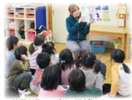
▲英語を使って楽しく活動

これら人数の確保や本紙5ページの子育て支援事業などのさらなる充実を図ります。 ●四つの柱で幼児教育を充実 市では、小学校への円滑な移行環境を整えるため、あいさつ・爽やかなあいさつの実施から基本的な生活習慣づくり、英語活動・コミュニケーション能力と豊かな表現力の育成、読み聞かせ、本に親しむ活動の実施など、特色ある園活動、各園の特色を生かした活動の展開の四つの柱を中心に取り組み、幼児教育の充実を目指していきます。