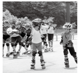
▲夏季営業中に楽しめるインラインスケート

第18回一般の部 □とき 4月6日(日)午前9時 □対象 中学生以上 □定員 12チーム(先着順) □受け付け開始 3月25日(火)午前9時 第16回少年の部 □とき 5月6日(火)午前9時 □対象 小学生以下 □定員 12チーム(先着順) □受け付け開始 4月8日(火)午前9時 共通 □ところ 恵那スケート場 □料金 1000円/チーム ☎ 恵那スケート場 ☎ 28-3390 (月曜日休館)