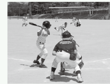
▲スポーツ少年団の事業で行われる野球交流会

市内には、野球やサッカー、リダー研修などいろいろな競技に取り組んでいるスポーツ少年団が10団体あり、活動を通じて仲間づくりや体力づくりを目指しています。 スポーツ少年団への登録の方法や内容などは、事務局に問い合わせください。 ☎ 市スポーツ少年団事務局