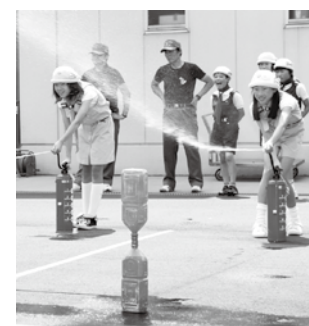
▲水消火器で消火訓練