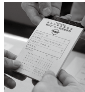
▲福祉タクシー利用乗車券

市では、重度の障がいのある方に、タクシーの基本料金を助成します。 □内容 1人当たり年間1冊（48枚つづり）。乗車1回につき基本料金相当額を助成 □利用期間 4月1日～平成27年3月31日 □対象 次の四つのいずれかに該当する方①身体障害者手帳1・2級の手帳のある方②じん臓機能障がい1級～3級で人工透析のため定期的な通院を必要とする方③療育手帳A判定の手帳のある方④精神障害者保健福祉手帳1級の手帳のある方 □申し込み方法 印鑑と該当の手帳などを持参して、窓口で申請する □交付 4月1日(火)から ※②の方を除き自動車税の減