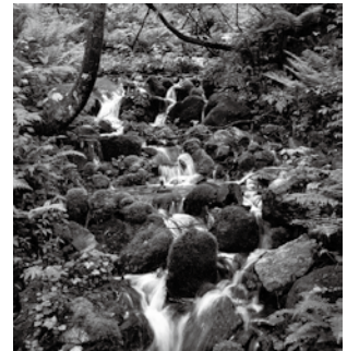
▲水源地を流れる源流

水源地域は、図面で指定されています。図面は、県庁林政課や恵那農林事務所、市役所林業振興課、県のウェブサイト(https://www.pref.gifu.jp/)「あふおれナビ」のページで確認できます(「あふおれナビ」で検索)。