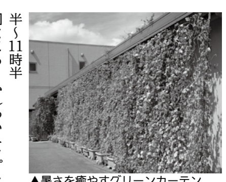
▲暑さを癒やすグリーンカーテン

レジ袋有料化収益金を市へ寄付 本年度もレジ袋有料化に伴う収益金の一部を、市に寄付していただきました。寄付金は市の環境保全事業に活用させていただきます。 ☐ 寄付事業者(敬称略)・金額 ▼ユニー(株) (ピアゴ恵那店) 117万2414円 ▼(株)ココカラファインヘルスケア(Zippドラッグ白沢恵那店) 25万1515円