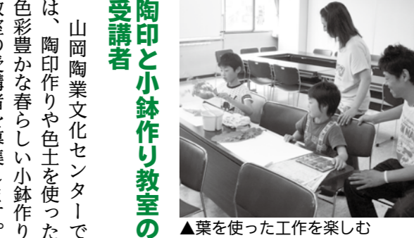
▲葉を使った工作を楽しむ