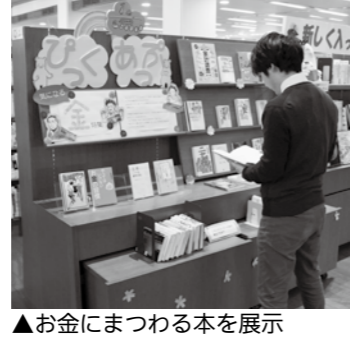
▲お金にまつわる本を展示