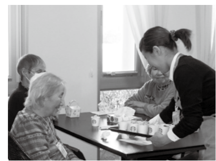
▲話をしながらコーヒーを味わう

高齢者 生き生き 長生き 気軽に相談やおしゃべりができる、ささゆり認知症カフェを開催します。 □ 日ごろの介護から少しだけ抜け出し、専門店が入れるコーヒーを飲みながら、ゆったりとした時間を過ごしてみませんか。参加を希望する方は地域包括支援センターへ申し込んでください。 □ とき 4月23日(水)午後2時~4時 □ ところ 喫茶ブルーム(市立恵那病院内) □ 対象 認知症の本人、家族、介護経験者、手伝いをする方 □ 料金 無料 □ 申請 地域包括支援センター(内線127)