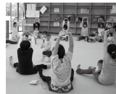
▲子どもと一緒に体操

▽非会員 100円 □親子体操 育児中のお母さんが子どもと一緒に体を動かして元気を回復する体操教室です。