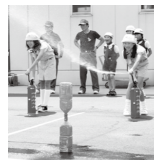
水消火器で消火訓練