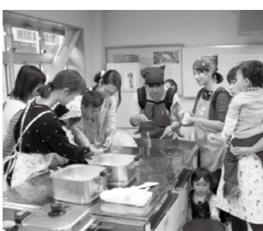
▲おやつ作りに親子で参加

□とき 4月18日(金)午後7時(午後6時半受け付け開始) □ところ 市保健センター