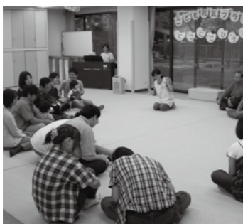
▲子どもと触れ合い遊びを楽しむ

□助成 1回の利用につき300円/人（個人の利用は年4回まで、団体の場合は何回でも利用できます） □申請 高齢福祉課（内線122）、各振興事務所