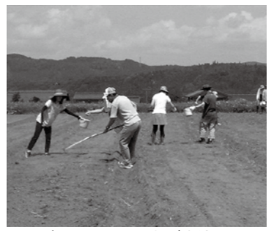
▲ソバの種まきで男女が交流

市では、男女の出会いの場を提供する「婚活イベント」を開催する団体を募集します。 婚活イベントを目的とした男女の出会いを提供するイベントを本年度中に1回以上開催し、次の二つに該当する団体 ①3人以上の市民で構成する団体(見合いパーティーや結婚支援を業務とする法人は対象外) ②市民の結婚支援を目的としてイベントを開催する団体 □定員 5団体(応募団体多数の場合は、事業計画を審査し、5月中に決定します) □市の支援 実施団体には、事業に掛かる経費の一部を補助し、イベントを開催する