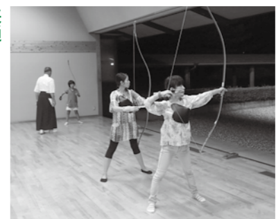
▲精神を集中して的を狙う