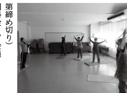
▲自分でできる整体を学ぶ