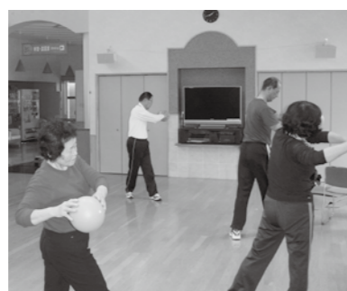
▲日常生活でできる簡単な運動