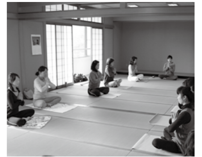
▲ヨガで体のゆがみを整える