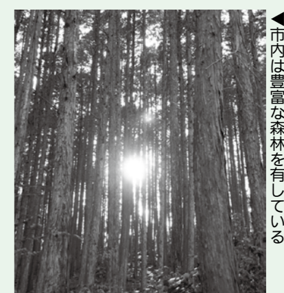
▲市内は豊富な森林を有している

森林をはじめとする身近な緑は、きれいな空気や水を供給し、国土を災害から守り、多くの恵みをもたらしてくれています。緑の募金は、一人一人が緑に親しみ健全で豊かな心を育む環境づくりを進め、緑豊かな郷土づくりなどの活動支援を目的として行われているものです。市では、緑化木の無償配布や小・中学校の緑化少年団の活動などに活用されています。また緑の募金は、東日本大震災の復興事業にも役立てられています。皆さんの協力をお願いします。 □募集期間 春募金=5月30日(金)まで 秋募金=9月1日(月)～10月31日(金)まで □窓口 農林課、市内各振興事務所 □問合せ 農林課(内線529)