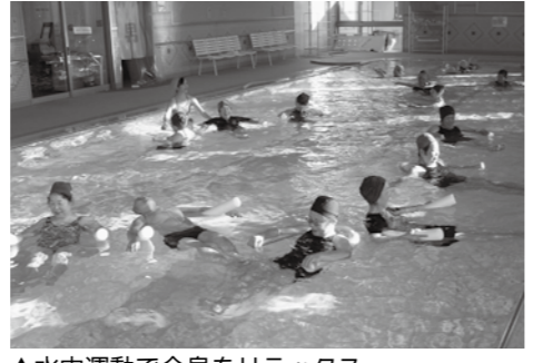
▲水中運動で全身をリラックス

トとき 6月11日、25日、7月9日、23日(水曜日)午後7時~7時40分(全4回) ト定員 20人 ト料金 2000円