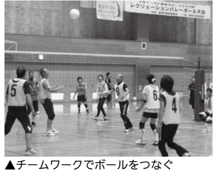
▲チームワークでボールをつなぐ

ポーツクラブ☎251-0068 アクアビクス教室 トとき 6月4日~7月30日(毎週水曜日)午後7時50分~8時40分(全9回)