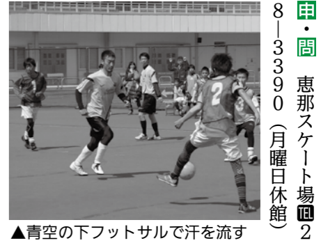
▲青空の下フットサルで汗を流す

トとき 6月22日(日)午前9時 トところ 恵那スケート場 ト対象 中学生以上 ト定員 12チーム(先着順) ト料金 1000円/チーム ト受け付け開始 5月27日(火)午前9時