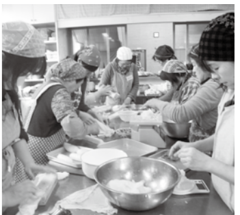
▲郷土料理の作り方を学ぶ