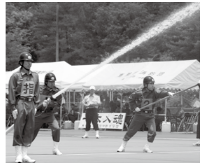
▲小型ポンプ操法で技術を競う

6月8日(日)、県クリスタルパーク恵那スケート場で、市制10周年記念第10回市消防協会消防操法大会が開催されました。消防団員の消防技術の向上と士気の高揚を目的に毎年行っている大会です。 本年度は小型ポンプ操法です。当市は昨年度の県消防操法大会で優勝しており、今大会も盛り上がりが見られます。当日は、地震体験車や音楽隊、バザーなども行います。会場周辺の駐車場が混雑します。乗り合わせて来場し、