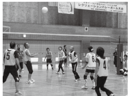
▲チームワークでボールをつなぐ

第6回えなイースト杯レクリエーションバレーボール大会 トとき 6月22日(日)午前9時 トところ まきがね公園体育館 ト料金 団体会員 無料 ト非会員 2000円/チーム ト締め切り 6月17日(火) ト抽選会 トとき 6月19日(木)午後7時 トところ イー・ストクラブハウス