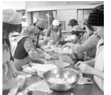
▲郷土料理の作り方を学ぶ