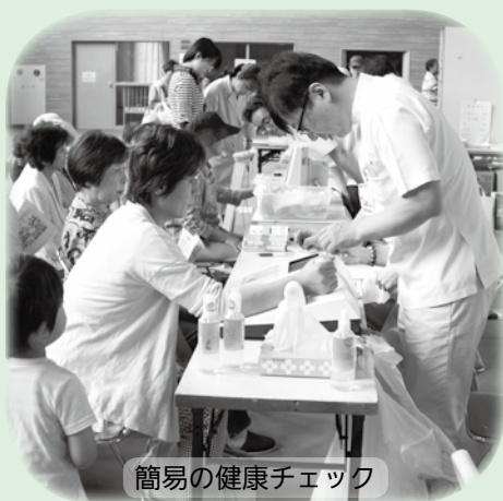
簡易の健康チェック