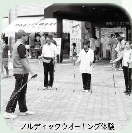
ノルディックウォーキング体験