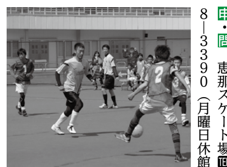
▲青空の下フットサルで汗を流す

一般の部の参加チームを募集します。 トとき 6月22日(日)午前9時 トところ 恵那スケート場 ト対象 中学生以上 ト定員 12チーム(先着順) ト料金 1000円/チーム ト受け付け開始 5月27日(火)午前9時