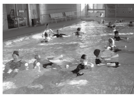
▲水中運動で全身をリラックス

姿勢を正し、健康的で美しい姿勢を身に付けませんか。 ト定員 25人 ト料金 無料 ト講師 施設職員 ト持ち物 水着、水泳帽子