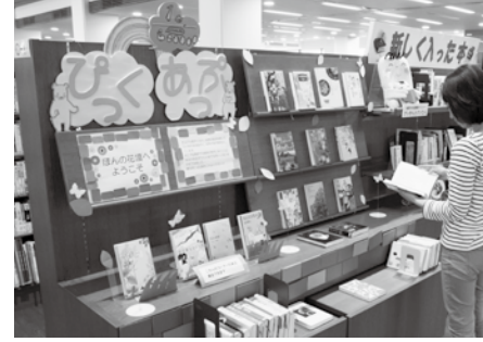
▲春の息吹を感じるような本を展示