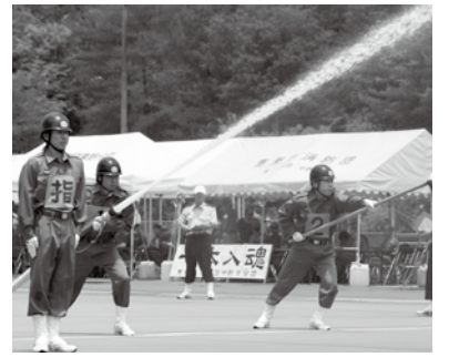
▲小型ポンプ操法で技術を競う

本年度は小型ポンプ操法です。当市は昨年度の県消防操法大会で優勝しており、今大会も盛り上がりが見られます。当日は、地震体験車や音楽隊、バザーなども行います。会場周辺の駐車場が混雑します。乗り合わせて来場し、