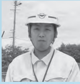
度會将仁 (平成23年度採用・26歳)

市道や農道、林道などの設計と施工や維持管理、水道や下水道施設の設計と施工や維持管理など、土木関係の業務に従事します。