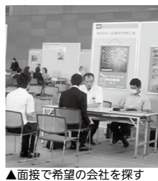
▲面接で希望の会社を探す

市雇用対策協議会では、事業所ごとのブースで会社説明会を行う「ひがしみの就職面接会2014」を開催します。