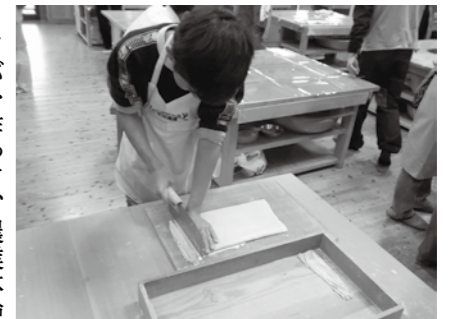
▲収穫したソバでそば打ちを体験

屋外広告物条例や、景観重要建築物と樹木の指定など市の景観に関わる調査や審議を行う、景観審議会委員を募集します。 □対象 市内在住の20歳以上で、次のいずれかに該当する方 ①建築物や構造物の設計に携わる方 ②まちづくりや景観づくりに関わる方 ③写真家 □応募方法 建設政策課に備え付けの応募用紙が任意の様式に ①住所 ②氏名 ③生年月日 ④職業 ⑤電話番号 ⑥応募理由(400字程度) を記入の上、応募ください。 □締め切り 7月31日(木) ※詳しくは市のウェブサイト( http://www.city.ena.lg.jp/ )をご覧ください □申込先 建設政策課(内線202)