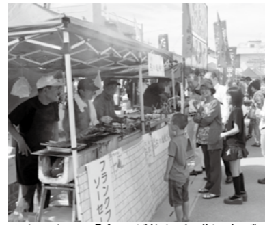
▲おいしい「食」が祭りを盛り上げる

市民総出の恵那の祭り「みじのみのり祭」に、にぎわいを添える恵那ぐるめ広場の出店者を募集します。 □とき 9月28日(日)午前10時～午後4時 □ところ 中山道大井宿広場 □出店数 15店(先着順) □料金 3000円/区画 (電気を使用する場合は、使用する機材に応じて別途電気代が必要です) □申し込み方法 商工会議所に備え付けの用紙に記入の上、直接かファクスで申し込む □締め切り 8月15日(金) ※区割りは抽選です □申込先 ENAみじのみのり祭実行委員会(商工会議所)