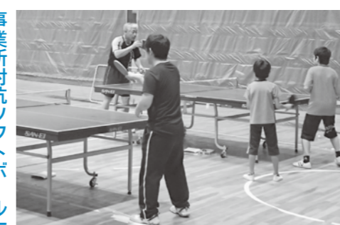
▲子どもからお年寄りまで楽しめる卓球

事業所対抗ソフトボール大会 市内の事業所対抗で開催する、ソフトボール大会の参加チームを募集します。職場の仲間とチームを作って参加してください。