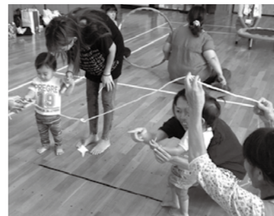
▲親子で一緒に体を動かす