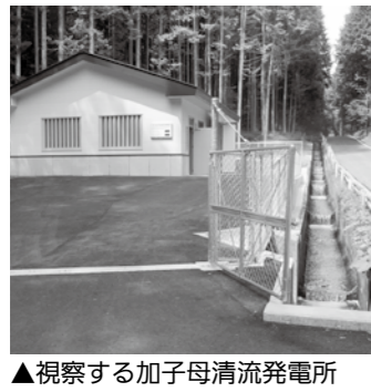
▲視察する加子母清流発電所

エネルギーの地産地消を目指して、太陽光利用の先進地長野県飯田市と、小水力利用を行っている中津川市の加子母清流発電所への視察研修に参加する方を募集します。