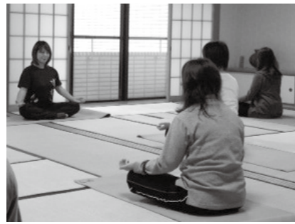
▲体のゆがみを整える