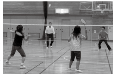
▲初心者も気軽にバドミントンを学ぶ