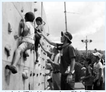
▲力を振り絞って人工壁を登る

笠置山クライミングエリアのオープン5周年を記念して、人工壁を使ったクライミング体験を開催します。 □とき 9月6日(土)午前9時～午後3時(雨天中止) □ところ 笠置コミセン □料金 無料 □その他 事前の申し込みは必要ありません。中学生以下には参加賞があります。