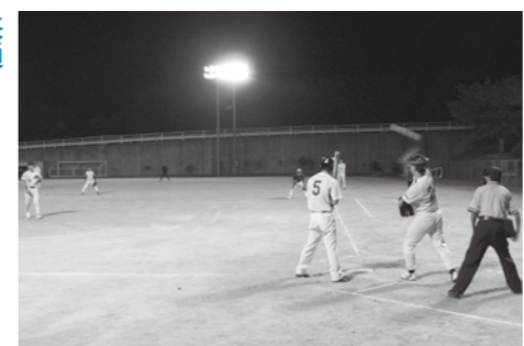
▲職場の仲間とチームを組んで汗を流す