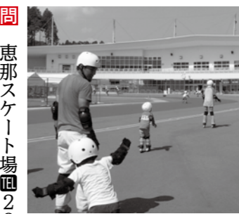
▲空の下でインラインスケートを楽しむ