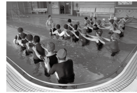
▲水中運動教室で体も心も健康に