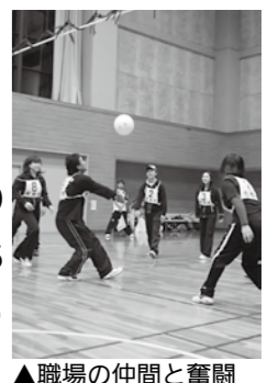
▲職場の仲間と奮闘