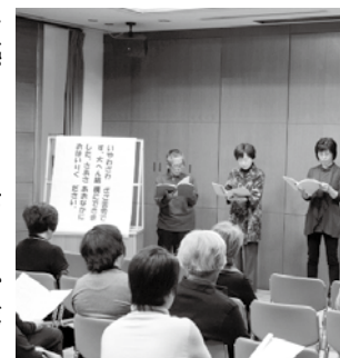
▲童話や小説などを朗読

を感じてもらおうと、第7回恵那朗読フェスティバルを開催します。 □とき 11月30日(日)午前10時15分～午後4時 □ところ 市中央図書館 □料金 無料 □内容 童話や児童文学、小説、エッセー、詩などの朗読 □時間制限 △1人11分以内 △2人10分以内 △3人以上15分以内