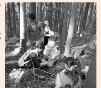
▲仲間と森造りを学ぶ