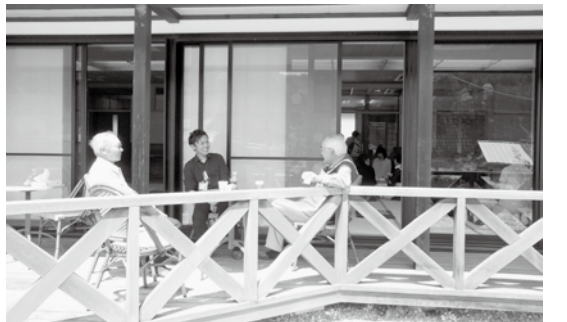
▲ゆったりと気軽な話ができる認知症カフェ

ゆったりとした時間の中で気軽にしゃべりができる、ささゆり認知症カフェを開催します。 コーヒーを飲みながら、認知症や介護についての悩み相談や交流をしませんか。医療や福祉の専門スタッフがいますので、認知症の方も家族も安心して過ごせます。 □とき 10月16日(木)午後1時～3時半(出入りは自由です) □ところ 福寿の里ふれあいセンター(上矢作町)