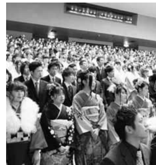
▲一生に1度の成人式

市内に住民票がある方は申し込み不要ですが、住民票が市外にある方は、11月27日(木)正午までに電話で申し込んでください。