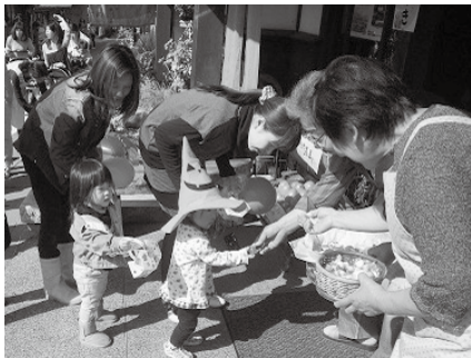
▲ハロウィーンの仮装をした子どもら

積み木を入れる袋、汚れてもいい服装 ハロウィーン かわいい仮装をして、岩村の町を歩きましょう。