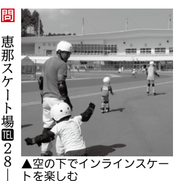
▲空の下でインラインスケートを楽しむ

募 集 事業所対抗レクバレー大会の参加チーム 市内の事業所対抗のレクリエーションバレー大会の参加チームを募集します。 □とき 10月31日、11月7日(毎回金曜日) 午後7時半競技開始 □ところ まきがね公園体育館 □対象 勤務する者でチームを編成する市内の事業所 □料金 無料