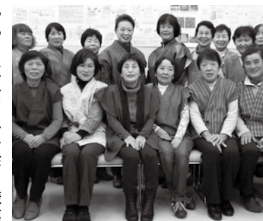
▲完成したやっこはなんてんを着る