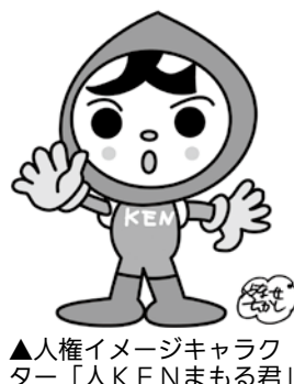
▲人権イメージキャラクター「KEN」

岐阜地方方法務局では、「全国一斉!法務局休日相談所」を開設します。日ごろの疑問や悩みなどを相談ください。 □とき 10月5日(日)午前10時～午後4時 □ところ 岐阜地方方法務局中津川支局 □料金 無料 □内容 土地建物の登記、土地の境界に関すること、人権相談など