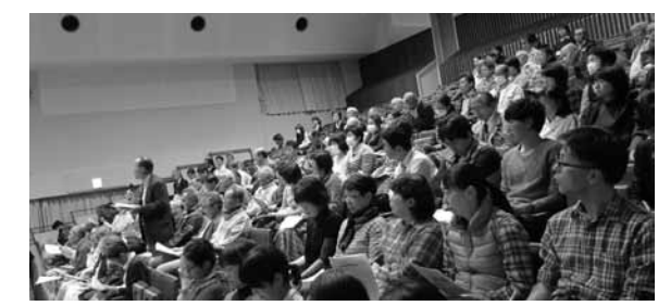
地域の意見を聞く