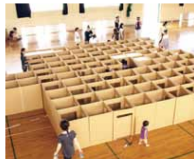
▲ことしの目玉、巨大段ボール迷路

49の展示ブースや19の物産販売、ことしのみじのみのり祭まんぶく番付入賞者の出店(展)があります。