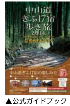
▲公式ガイドブック

公式ガイドブックは、市役所ロビーや観光交流室、市観光物産館えなてらすで入手できます。ぜひ参加ください。