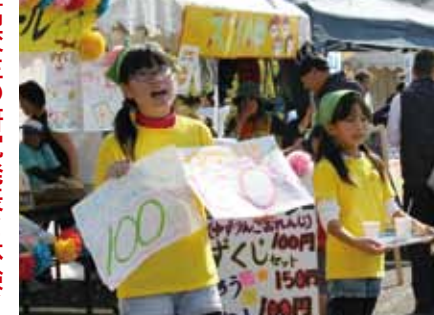
▲小学生が商売を体験