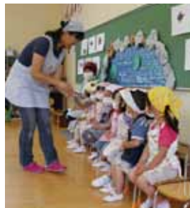
▲子どもの成長を支える保育士

来年度4月1日採用予定の市職員を募集します。 □職種と人数 ▽一般事務職(大卒) 11名(30歳まで) ▽一般事務職(身体障がい者枠) 11名(30歳まで) ▽保育士・幼稚園教諭 11名(45歳まで) ▽看護師 11名(55歳まで) ※年齢は平成26年4月2日現在