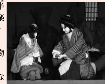
大井文楽保存会が伝統の心と技を披露

とき 11月3日(月)午後0時20分(開場は午前11時半) ところ 恵那文化センター 出演団体 大井文楽保存会、半原操人形浄瑠璃保存会、真桑文楽保存会、阿波木偶箱まわし保存会 料金 無料 その他 食事や特産品などの物販もあります。 問 第19回県文楽・能大会えな2014実行委員会(文化スポーツ課内) ☎ 43-2112