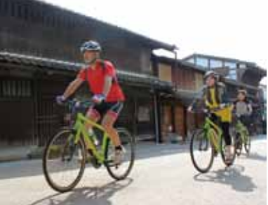
▲地域を巡るツアーガイド

自転車を活用してこの地域の自然や観光資源を案内する、自転車ツアーガイドの養成講座を開催します。