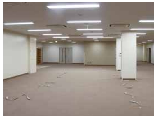
▲保健センターが配置される西庁舎2階