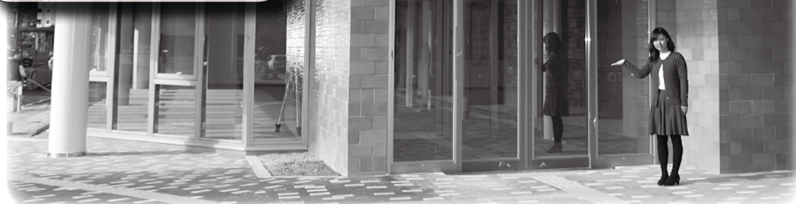
▲まもなく利用が始まる西庁舎の入口

市では、西庁舎の完成に伴い、市民課内に証明窓口を設置します。証明窓口では、住民票や印鑑証明書などの他、所得証明書や固定資産評価証明書など税務課で発行する証明書の一部を発行します。これにより、窓口を移動することなく、証明書を受け取ることができるようになります。