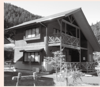
▲豊かな自然の中にあるコテージ

道の駅ラ・フォーレ福寿の里では冬期限定で、値打ちな料金で越沢コテージに宿泊できるコースを設定しました。 2階建てのコテージ1棟に8人まで宿泊できます。まきストーブもあり、冬でも暖かく快適に過ごせます。懇親会や無尽、同窓会、来客接待などにとっても便利に利用できます。