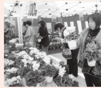
▲色あざやかなシクラメンを販売

□とき 12月6日(土)午前9時～午後3時 □ところ 恵那駅前広場一帯 □内容 シクラメンの販売や屋台村(豚汁など)、たんぼぼ作業所による太鼓他 □その他 当日は、恵那まちなか市やJRさわやかウォーキングも開催します。 問 恵那中央通り商店街振興組合 ☎ 25-1431