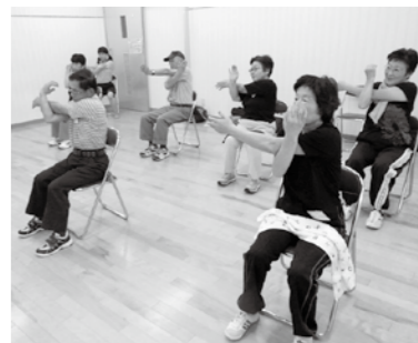
健康でいるための体づくり

いつまでも健康でハツラツとした人生を送れるよう、介護予防のための健康シニア応援塾を開催します。 筋トレやバランス運動、脳トレ、口腔衛生、栄養などの要素を取り入れた指導で、体の機能の改善と向上を目指しませんか。 □とき 平成27年1月13日～3月31日(毎週火曜日) 午前10時半～正午(全12回) □ところ アグリパーク恵那(長島町) ※送迎あり(要相談)