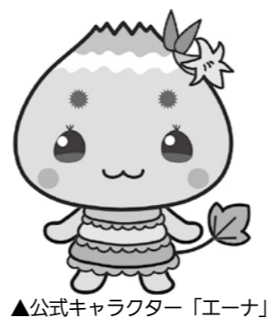
▲公式キャラクター「エーナ」

市では、10月11日に誕生した市公式キャラクター「エーナ」のイラストの使用と、着ぐるみの貸し出しを受け付けています。 各種イベントや商品の包装などに利用ください。申請書は、市のウェブサイト( http://www.city.ena.lg.jp/ )から入手できます。 詳しくは、市のウェブサイトに掲載している取扱要領をご覧ください。 □注意点 ①イラストは加工しないでください。②着ぐるみの貸し出しは、申請者で着る人、付き添う人を手配してください。 問・問 観光交流室(内線5