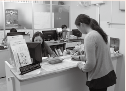
市民課の窓口は午後6時まで