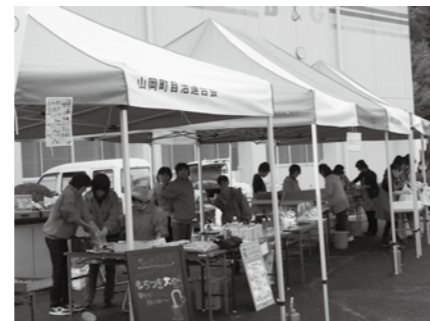
▲山岡町の「秋の祭典」で活用したテント

宝くじ事業は、一般財団法人自治総合センターが、宝くじの社会貢献広報事業として宝くじの受託事業収入を財源として行われているもので、地域活動の充実や強化を目的としています。整備された備品は、各種イベントや自治会での活動に活用されます。 問 まちづくり推進課(内線638)