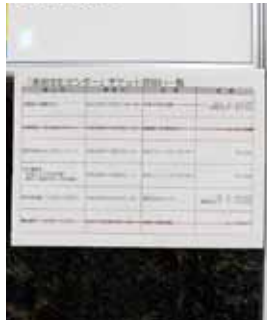
▲窓口付近に一覧を掲示

恵那文化センターでは、市内各所で開催するイベントや、他市で開催する事業などのチケットを、主催者から依頼を受けて取り扱っています。最近では、チケットの購入者が立ち寄りやすいこともあり、取り扱いをするチケットの件数も増えていきます。 今後は、来館者が分かる場所に取り扱いチケットの一覧を掲示していきます。 (恵那文化センター)