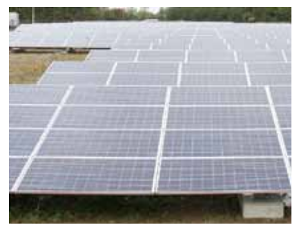
▲太陽光発電の事業

市町村へ申告することが義務付けられています(地方税法383条)。対象の方は、申告をしてください。 □申告の対象 ①市内に事業用償却資産を所有する方②廃業や転出などの理由で市内に償却資産を所有しなくなった方 □対象の資産 会社や個人で事業(工場や商店の経営、駐車場やアパートの貸し付けや太陽光発電など)を営むために所有している事業用資産(土地と家屋以外)で、所得税法が法人税法に規定されている所得の計算で減価償却の対象となる資産 □申告期限 平成27年1月30日(金) □提出先 税務課 ■問 税務課(内線137)