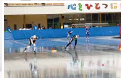
▲スピードスケートの全国大会も開催

冬季はスケート場としてスピードスケートや一般滑走などに使用されている他、各種教室を開催し、スケートに親しんでもらっています。冬季以外はインラインスケートやフットサル、各種イベントに利用できる複合施設です。 日本で最西端、最南端にある屋外400㍍スピードスケートリンクは、主要道路や鉄道からのアクセスも良く、風の影響が少ないのが特徴。豊かな自然の中で自分に合った楽しみ方を見つけてください。