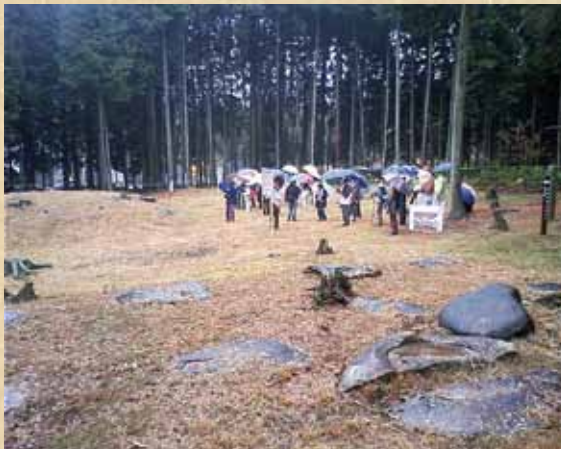
基壇と礎石が残る伽藍の中心 (手前が塔、奥が金堂)

国史跡「正家廃寺跡」は、築地で囲まれた東西約110 メートル 、南北約70 メートル の寺域を有し、塔や金堂、講堂などの主要伽藍を法隆寺式に配置する古代寺院。8世紀前半に造営が開始され、9世紀後半に主要伽藍の火災を契機に廃絶したことがこれまでの調査で明らかになっている。