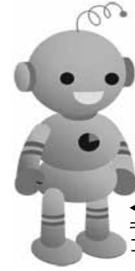
工業統計キャラクター コウちゃん

恵那病院では、糖尿病について正しい知識を持って健康管理してもらうため、糖尿病予防調理実習を開催します。この調理実習では、管理栄養士の指導で材料や調味料を計量しながら料理を作り、目で見て味わって食事療法への理解を深めることを目的としています。