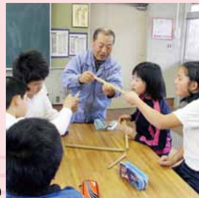
▲道笛の作り方を丁寧に指導