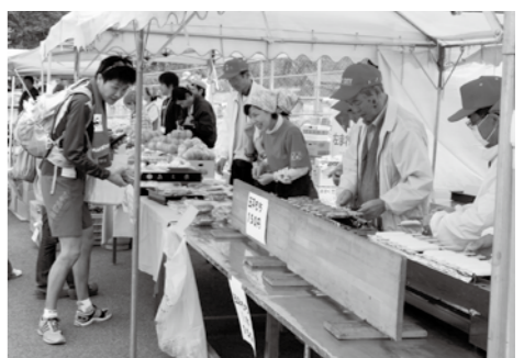
▲ハーフマラソン来場者に食べ物などを販売

4月19日(日)に開催する、第14回恵那峡ハーフマラソン大会当日の出店者を募集します。