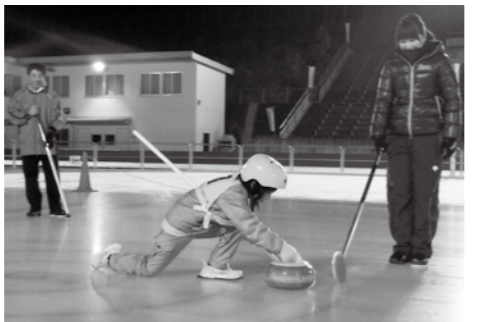
▲普段はできないカーリングを体験