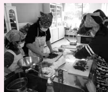
▲チョコレートを使って作る