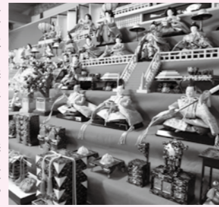
▲町中に飾られるおひなさま