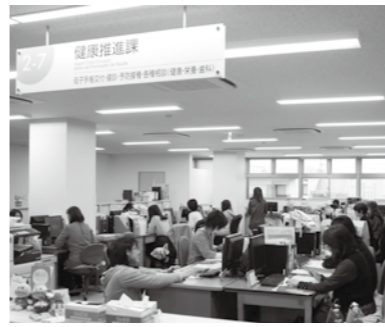
▲明るい雰囲気職場で働く