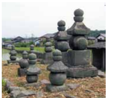
▲東野にある五輪塔