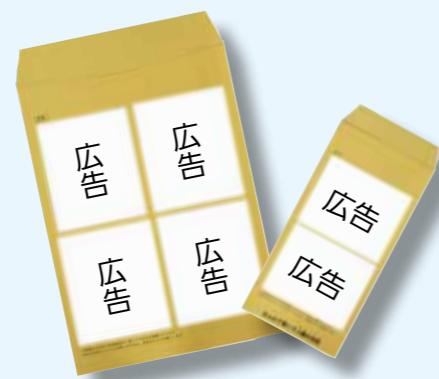
▲角2封筒(左)と長3封筒(右)の広告位置のイメージ

※申請書は市ウェブサイト(http://www.city.ena.lg.jp/)からも取得できます 締め切り 7月31日(金) 申請 財務課(内線435)