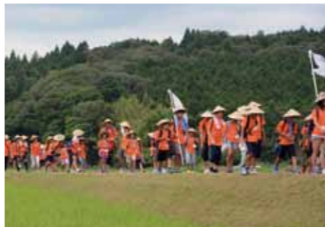
▲市内約50kmを歩く3日間の貴重な体験