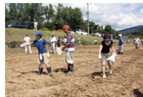
▲豊作を祈って種をまく

お菓ずし(予備日は8月23日)▽10月下旬ソバの刈り取り、菅葺き古民家で昼食(五平餅)▽11月29日(日)収穫祭、そば打ち体験、新米試食(地元コシヒカリ)など 料金▽大人16000円/人▽子ども(3歳から中学生まで)4000円/人 締め切り 7月31日(金) その他 参加者には、旬の