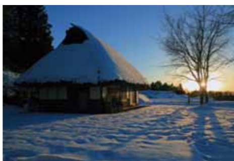
▲昨年のコンテストで特選を受賞した作品

三郷町の魅力を再発見と新たな観光資源の発掘を目的とした、「三郷DEフォトコンテスト」を実施します。