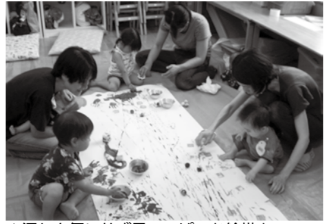
▲汚れを気にせず目いっぱいお絵描き

トレーニングについての相談ができます ままがね公園体育館健康体力センターで過去にトレーニング講習を受講したがやり方を忘れてしまった方は、スタッフと相談に乗ります。