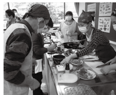
▲管理栄養士の指導で計量や調理

市立恵那病院では、糖尿病を学んで健康管理をするために、糖尿病に関する各種教室を開催しています。どなたでも参加できますので、この機会にぜひ申し込みください。