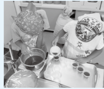
▲友達と和菓子作りを楽しむ

り用の容器、飲み物 □締め切り 7月28日(火) 申・問 えなイースト総合スポーツクラブ ☎ 251-0068 (平日午前10時～午後3時)、✉ e-spo@gsccenai.jp