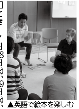
▲英語で絵本を楽しむ

各コミセンをサテライト会場とした天の川イベントを開催します。 「恵那の昔話と歌に学ぶクシヨップと読み聞かせ」 □とき 7月29日(水)午前10時～11時 東野コミセン 「夏祭り紙芝居」 □とき 8月8日(土)午後6時～7時 東野コミセン 「お薦め図書の紹介と展示」 □とき 8月25日(火)まで 上矢作コミセン 「各コミセンでも天の川イベントを開催」 各コミセンをサテライト会場とした天の川イベントを開催します。 □とき 7月28日(火)、29日(水) 30日(木)午前10時半～11時、午後2時～2時半 ※28日(火)は午後のみ