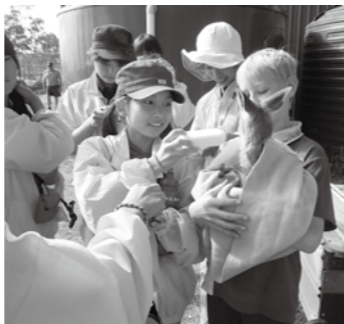
▲現地の学生と交流(前回)