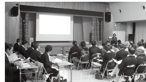
▲地域の意見を聞く