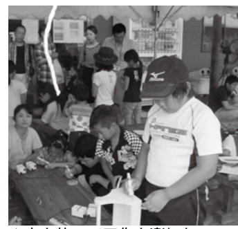
▲木を使って工作を楽しむ