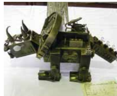
▲工夫が生み出した作品

9月4日(金)から6日(日)まで、市民会館で行う恵那発明くふう展に出展する作品を募集します。 普段の生活の中で思いついた、ちょっとした工夫や発明を応募してみませんか。 □部門 一般の部、児童生徒の部、児童生徒の部、児童生徒の部