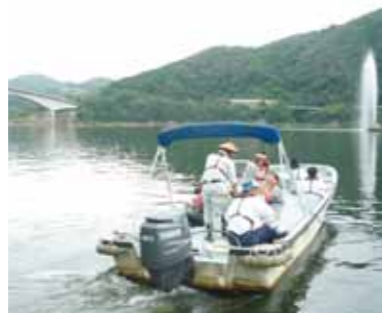
▲船に乗ってダム湖を巡視