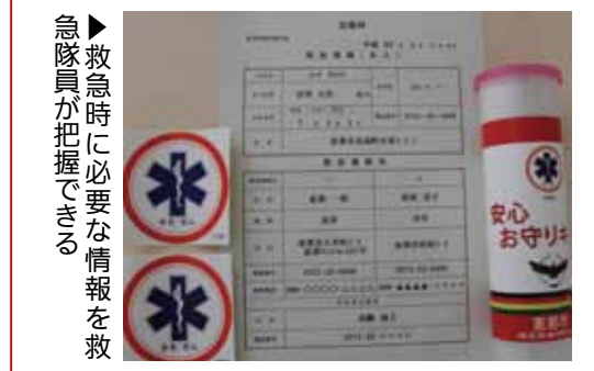
▶救急時に必要な情報を救急隊員が把握できる

□新規申し込み対象 ①65歳以上の高齢者で独り暮らしか高齢者のみの世帯②65歳以上の高齢者で日中独居の方③言語や聴覚の障がいなどにより、意思疎通の困難な独り暮らしの方 □申し込み方法 地区の民生児童委員(大井地区の方は各自治会長)か高齢福祉課、各振興事務所に申し込む ☎ 高齢福祉課(内線165)