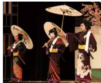
▲地域で伝承されている伝統芸能

た団体、特に地域の音楽や美術、演劇、伝統芸能の各分野で努力している団体を対象に助成を希望する団体を募集しています。