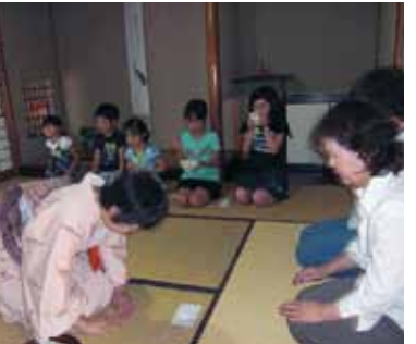
▲礼儀正しく抹茶を飲む

相続や遺言など誰にも相談できずに困っている、農地にかたからないなど、専門家の助言がほしい方は気軽に相談ください。 □とき 9月17日(木)午後1時～4時 □ところ 恵那文化センター □内容 相続、遺言、農地の