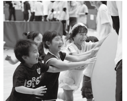
▲体験コーナーで楽しむ子ども

「阜」が県内で初めて開催されます。その1年前となるこの時期に、レクリエーションフェスティバルを県内の各圏域で開催します。各種目の体験コーナーは、子どもからお年寄りまで気軽に参加できます。この機会に、ぜひ参加ください。