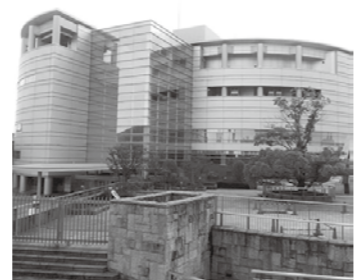
▲ぎふ清流文化プラザ

□ところ ぎふ清流文化プラザ(岐阜市学園町) □定員 各500人 □料金 公演により異なる □申し込み方法 県教育文化財団ウェブサイト ( http://www.g-kyoubun.or.jp/ )をご覧ください。 申・問 (公財) 県教育文化財団企画運営課 ☎058-233-5810