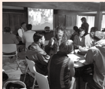
▲移住希望者と交流する

□とき 10月18日(日)午前10時 □ところ あんじやないの家(三郷町椋実地内) □定員 15人(先着順) □料金 1000円(材料費を含む) □締め切り 10月8日(木)