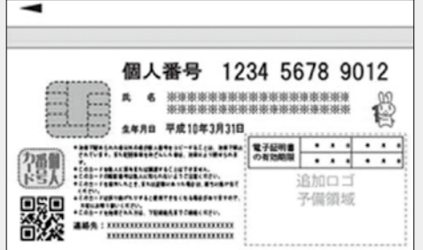
▲マイナンバーは12桁の番号

マイナンバー(社会保障番号)が、10月から個人に通知されます。平成28年1月以降、事業者の皆さんは、社会保障や税の手続きのため、従業員の方からマイナンバーを取得し、適切に管理・保管する必要があります。