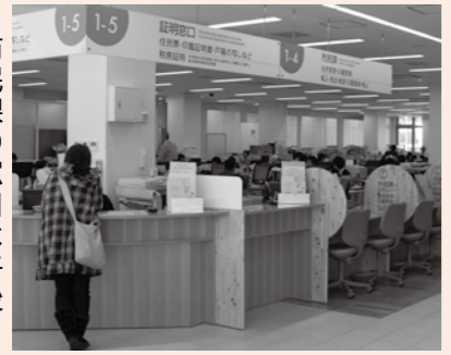
市民課の窓口は午後6時まで

平日の市民課の窓口は午後6時まで 6時まで 取り扱い項目 1 住民票の証明発行 2 戸籍の証明発行 3 印鑑証明の発行 4 印鑑登録 5 税に関する証明書(所得証明書、課税証明書、所得課税証明書、非課税証明書、車検用の軽自動車税納税証明書、公課証明書、固定資産評価証明書、固定資産名寄帳兼課税台帳) 休日(恵那文化センター)で発行 取り扱い項目 1 住民票の証明発行 2 印鑑証明の発行 3 印鑑登録 4 税に関する証明書(所得証明書、課税証明書、所得課税証明書、非課税証明書、車検用の軽自動車税納税証明書、公課証明書、固定資産評価証明書、固定資産名寄帳兼課税台帳) 休日(恵那文化センター)で発行 市内に住民登録している方は、パスポートの申請や受け取りが市役所でできます。県内に住所が無く、市内に住んでいる方の居所申請も受け付けています。 平日の午前9時~午後5時 証明書の広域交付 市内か中津川市、瑞浪市、土岐市、多治見市のいずれかに住民票や戸籍のある方は、5市の市役所や支所などでも住民票や印鑑証明、