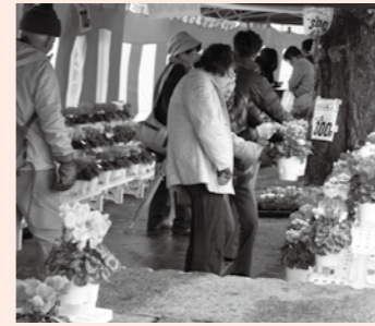
▲色鮮やかなシクラメンを販売

□とき 12月5日(土)午前9時～午後3時 □ところ 恵那駅前広場一帯 □内容 シクラメンの販売や屋台村(豚汁など)、たんぼぼ作業所による太鼓他 □その他 当日は、恵那まちなか市やJRさわやかウォーキングも開催します。 問 恵那中央通り商店街振興組合 ☎ 25-1431