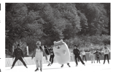
楽しいアイススケート

恵那スケート場の冬季営業は2月21日(日)に終了します。最終日は感謝イベントとしてスケート滑走料を無料にします。本年度最後のアイススケートを、家族や友人と楽しみませんか。