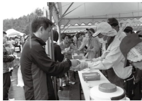
▲ハーフマラソンの参加者へ商品を販売

トレーニング講習会(2月) ▷とき=18日(木)午前10時(託児付)、10日(水)・24日(水)午後7時、27日(土)午前10時 ▷料金=520円 ▷持ち物=屋内シューズ ▷対象=高校生以上(要予約・時間厳守) トレーニング相談日(2月) ▷とき=4日(木)・16日(火)午後6時～8時、18日(木)・27日(土)午前10時～正午 プチ講習(2月) ▷とき=5日(金)(筋トレ)、12日(金)(えーなちゃん体操)、19日(金)(ストレッチポール)、26日(金)(脳トレーニング)午前10時～10時半 ▷料金=200円/回 体育施設の貸し出し抽選日(3月分) ▷とき=2月23日(火)午後7時 共通 ▷ところ=まきがね公園体育館 ☎・問 まきがね公園体育館(市体育連盟) ☎ 25-6478(月曜日休館)