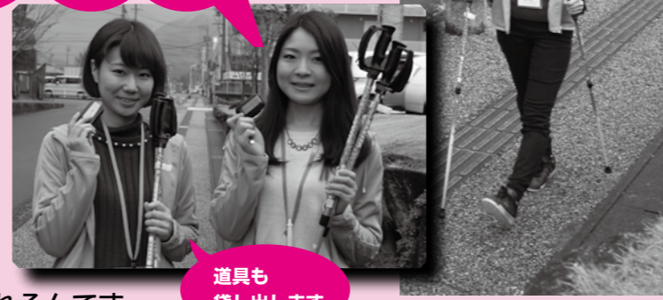
道具も貸し出します

「お正月に食べ過ぎてしまった」「ことしこそ運動を始めたい」と思っている方に朗報です。