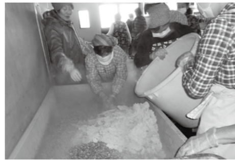
▲講師の指導の下、みそを造る

恵那産の大豆と恵那のおいしい水を使い、無添加で無香料のみそ造りを行う講座の受講生を募集します。