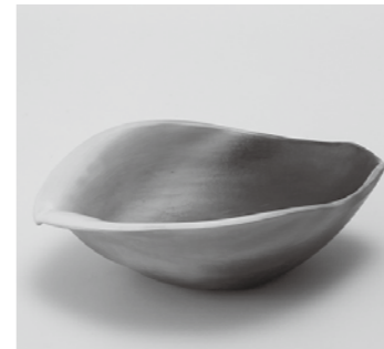
▲吉田喜彦《黒陶蓮弁》

吉田氏の代表作70点に加え、彼が長年にわたって収集してきた民族美術などを含むコレクション約100点を併せて展示し、その創作のル