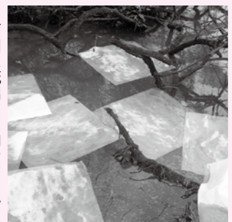
▶河川に流出した油をオイルマットで吸い取る