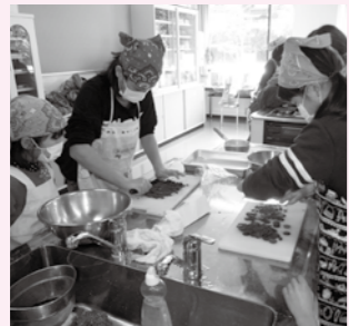
▲チョコレートを使って作る