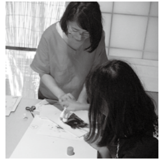
▲「ともに」作品を制作