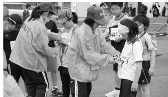
▲マラソン出場者を陰で支えるボランティア