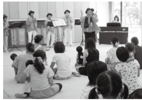
▲フルーツ・オカリナーフレンズの演奏