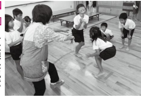
児童と放課後の時間を過ごす指導員

子ども元気プラザでは、利用者の親子と一緒に遊んでくれる中高生のボランティアを募集します。親子の触れ合い遊びに参加し、小さな子どもと触れ合う体験をしてみませんか。興味のある方はぜひ申し込みください。