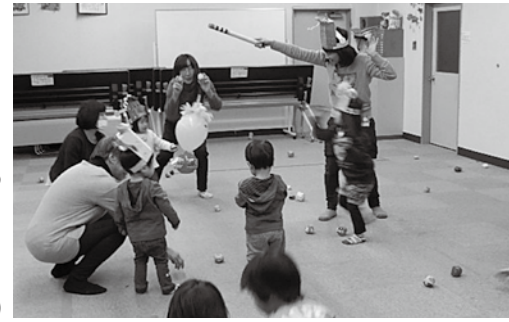
▲部屋をいっぱい使って家ではできない遊び

三郷町へ子育て支援センター指導員が訪問します。一緒に触れ合い遊びをしたり話をしたりします。気軽にお越しください。