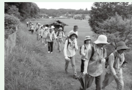
▲明知鉄道駅から名所を訪れる

準備講習会 6月4日、11日、18日、25日(毎土曜日)午前9時20分〜午後0時半□料金 2000円(1回でも4回でも同一金額)