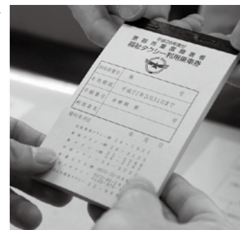
▲福祉タクシー利用乗車券

申請する □交付開始日 4月1日(金) ※②の方を除き自動車税の減免を受けている方は対象外 □申請 社会福祉課(内線182)、恵那南部5振興事務所