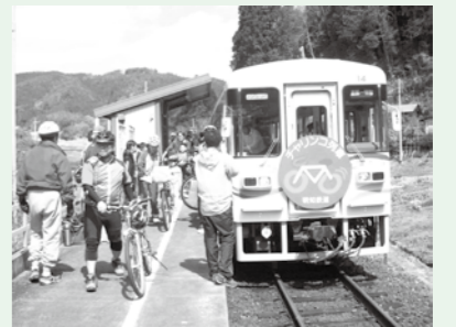
▲明知鉄道発、自転車の旅

4月から11月まで、毎月第2土曜日に明知鉄道を利用するチャリンコ列車を開催します。