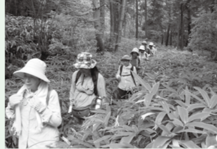
▲大自然の中を仲間と歩く