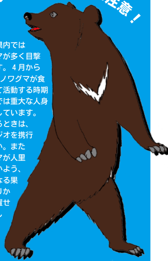
☎ 農林課 (内線 368)

本年度、県内ではツキノワグマが多く目撃されています。4月から11月はツキノワグマが食べ物を探して活動する時期です。他県では重大な人身事故も発生しています。 山林へ入るときは、クマ鈴やラジオを携帯してください。またツキノワグマが人里へ出さないよう、クマの餌となる果物などの残りを放置せず早期除去してください。