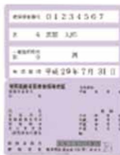
▲新しい被保険者証は薄い紫色

農作物へ被害を及ぼすアライクマヤヌートリアの捕獲までの手続きや、箱わなを使った捕獲方法などを学ぶ防除講習会を開催します。