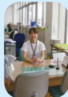
▲窓口は西庁舎1階 子育て支援チーム

どんなサポートを しているの? 妊娠から出産、子育 てまで、切れ目なく サポートします。