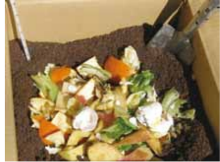
▲生ごみを使って堆肥を作る

ダンボールコンポスト講座 30センチ四方の段ボール箱で、約3カ月の生ごみを処理でき... □とき 7月23日(出)午前9時半〜11時 □業務内容 長島町久須見、笠置町約130世帯の水道検針業務 ※奇数月のみ □定員 1人 □給与 平均月額約1万7千円(経費含む) ※給与発生は奇数月のみ □条件 自家用車やオートバイ、自転車などで業務が行えること □その他 研修期間あり □申し込み方法 履歴書を郵送か持参する □締め切り 7月29日(金)必着 申・問 〒509-7292(住所不要) 上下水道課(本庁舎2階、内線222)