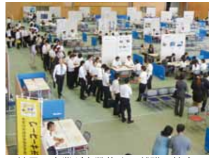
▲地元の企業が多数集まる就職面接会

市雇用対策協議会では、事業所ごとのブースで会社説明会を行う「ひがしみの就職面接会2016」を開催します。申し込みも履歴書も不要で