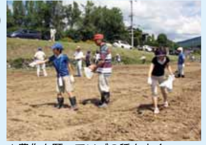
▲豊作を願ってソバの種をまく

道の駅そばの郷らっせいみさとは、ソバの種まきから刈り取り、そば打ちまで体験する「そばオーナー」を募集します。ソバを作って、農業体験をしてみませんか。 □日程 ▽8月20日(出)ソバの種まき、寿老の滝で昼食(ほお葉ずし)(予備日8月21日)