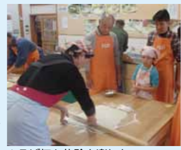
▲そば打ち体験を楽しむ

▽10月下旬ソバの刈り取り、菅葺き古民家で昼食(五平餅) ▽12月3日(出)収穫祭、そ