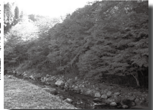
下ヶ淵のカエデ (明智町) 甚平坂のハナノキ (大井町)

大井町の「甚平坂のハナノキ」と明智町の「下ヶ淵のカエデ」が、6月1日に市の景観重要樹木に指定されました。