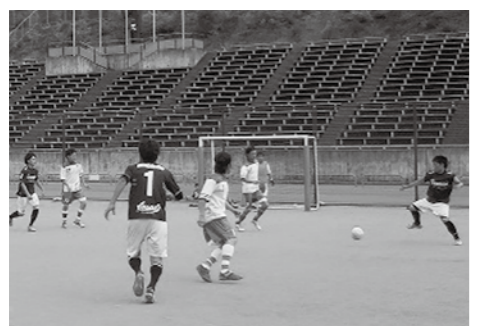
▲熱戦が繰り広げられるフットサル大会

で行えます □料金 3000円 ※教室初日の受け付け時に支払ってください □講師 市卓球協会指導員 □持ち物 ラケット(貸し出しも可)、屋内シューズ、タオル、飲み物 □受け付け開始 7月27日(水)午前9時 ※電話申し込み可