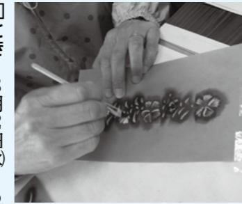
▲自分で掘った型紙を使って染める

染め型紙彫りと、型紙を使って化学染料でエコバッグに型染めをするワークショップを開催します。ぜひお越しください。 □とき 8月2日(火)〜5日(金) (いずれか1日) 午前10時〜午後3時 □ところ 岩村コミセン □定員 各15人(先着順) □料金 ▽大人11800円(型紙用額付き) ▽中学生以下11200円(額無し)