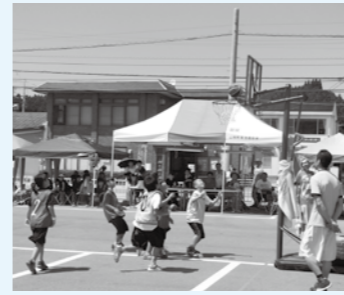
▲3対3で行うバスケットボール

やまおかふるさとまつりで開催する、バスケットボールの3on3大会の参加チームを募集します。仲間と参加しませんか。 □とき 8月15日(月)午後1時 □ところ 山岡振興事務所 周辺 □定員 ▽小学生116チーム ▽一般(中学生以上)12チーム ※各チーム4人まで。定員になり次第締め切り □料金 ▽小学生11000円/チーム ▽一般12000円/チーム ※保険代と賞品代を含む