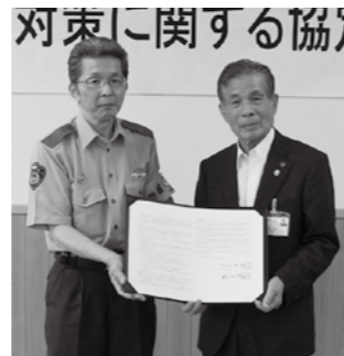
▲恵那警察署野々村署長(左)

認知症の原因とする行方不明が発生しないように、万一行方不明になっても無事に早く発見できるように、警察署と市とが連携して対応することが目的です。協定内容は、