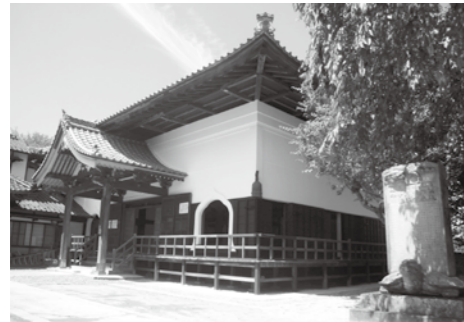
▲修理が完了した浄光寺の本堂

平成26年度から行ってきた市指定有形文化財浄光寺本堂の保存修理が完了しました。8月1日から一般公開をします。