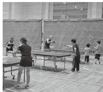
▲丁寧に卓球を教えてください

ながら、ゆったりとした時間を過ごしませんか。 □とき 8月24日(水)午後2時~4時 □ところ 東濃地域木材流通センター木ポイント(長島町) □料金 無料 □対象 認知症の本人、家族、認知症に関心のある方なども ※事前に申し込みが必要です 申・問 地域包括支援センター(内線168)