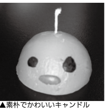
▲素朴でかわいいキャンドル

ダンボールコンポスト講座 30分 四方の段ボール箱で、約3カ月の生ごみを処理できます。臭いや汁漏れの心配