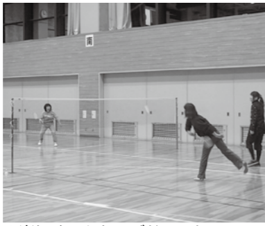
▲楽しくみんなでバドミントン

対象 小学4年生以上 定員 20人(先着順) □料金 3000円 □中止確認 教室当日午後4時半以降に各自で問い合わせる □受け付け開始 7月29日(金)午前9時 □申し込み方法 電話で申し込み 卓球教室 □とき 8月24日~11月9日(10月5日、12日を除く毎週水曜日)午後7時半~9時(全10回) □ところ まきがね公園体育館 □対象・定員(先着順)▽ 硬式卓球クラスII中学生以上・15人 ▽ラジボールド卓球クラスII40歳以上・10人 ※ラジボールド卓球はボールが少し大きく、スピードがゆっくりで初心者でも楽しめます