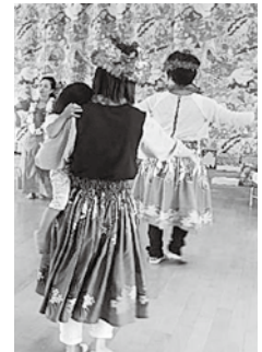
▲親子でフラダンス

い衣装を身にまとい、フラダンスを踊ってみませんか。癒やされる時間を満喫しましょう。