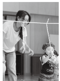
▲親子で競技をする