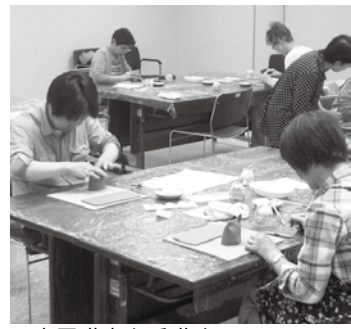
▲市民講座を受講する

□受け付け開始 9月10日（土）午前9時 ※前期講座の再受講受け付け開始は9月15日（土）午前9時 申・問 恵那文化センター ☎ 25-5121 ※市民会館、各地区コミセンでも申し込み、問い合わせ可