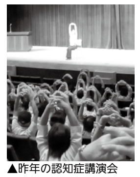
▲昨年の認知症講演会

より多くの方に、認知症の理解と予防の大切さを知ってもらうため、運動をテーマにした認知症講演会を開催します。脳と体の機能を効果的に向上させる「コグニサイズ」を、ぜひ会場で体験してください。 □とき 9月11日（日）午後0時半～3時 □ところ 恵那文化センター