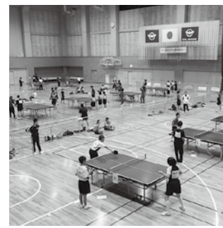
▲盛り上がる卓球大会

3人1組で行う団体戦卓球の部と、ダブルスでのチーム戦と、個人戦で行うラージボールの部で行う卓球大会出場チームを募集します。男女問わず、誰でも気軽に参加で