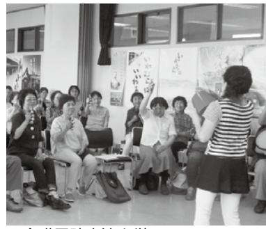
▲介護予防方法を学ぶ

□とき 9月14日（水）、21日（水）、30日（金）、10月5日（水）、12日（水）、20日（水）午前9時半～正午