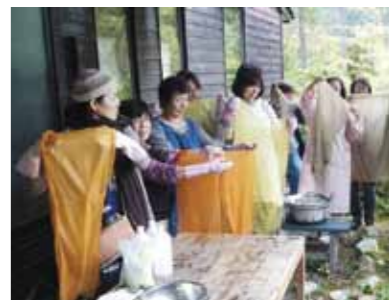
▲カラフルな草木染めを体験

※10月12日(水)は開催しません □ところ 岩村コミセン集合 □定員 各5人(定員になり次第締め切り) □料金 3500円(昼食代含む) ※マフラーの草木染めを希望の方は、別途1500円が必要