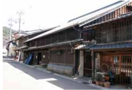
▲歴史的建造物や風景を切り取る

国から認定を受けた中部地方の歴史まちづくり認定都市(高山市、亀山市、犬山市、恵那市、美濃市、明和町、岐阜市、郡上市、名古屋市、伊賀市(岡崎市)で実施する「歴まちフォトコンテスト」の作品を募集します。 中部地方に息づくたくさんの歴史や文化を地域の方々に知ってもらい、その魅力を拡大することが目的です。 □撮影対象 歴史的建造物や風景、活動など