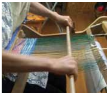
▲懐かしい機織りを体験

昔懐かしい機織りを、卓上織機で気軽に体験してみませんか。 1日頑張つて機織りする、自分で使うコースターやテーブルクロス、マフラーなどができあがりまます。できあがった作品は当日持ち帰れます。