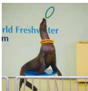
▲アシカショーは毎日開催

※最終入館は閉館の1時間前 □持ち物 運転免許証や健康保険証など、年齢を確認できるもの