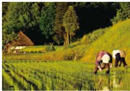
▲昨年の特選受賞作品

三郷町まちづくり委員会による「みさとDEフォトコンテスト」を実施します。三郷町の魅力の再発見と、新たな観光資源の発掘につながることを目的とし、三郷町にまつわる題材の作品を募集します。 □各賞 グランプリ賞1点、ヒューマン賞1点、伝統・文化賞1点、景観・風景賞1点、特別賞数点 □題材 三郷町内の人、伝統文化、風景など □応募資格 プロ、アマチュアは問いません □応募サイズ 四つ切、六つ切(共にワイド可)、デジタル画像はA4サイズも可