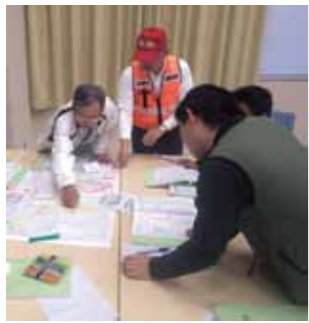
▲防災の知識を習得する

防災アカデミーの受講者 市では、地域の防災リーダーを養成する防災アカデミーの受講者を募集します。防災アカデミーを受講すると、災害に対する正しい知識や技術が習得でき、防災士認定試験を受験することができます。 平時には地域の防災訓練や研修を行い、災害時には避難の支援や救済活動を行う人材を養成し、地域の自助や共助による防災力を高めます。 防災アカデミー □とき 10月9日、11月20日、12月4日、1月15日(毎週日曜日)午前9時～午後4時(全4回)