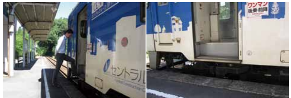
▲明知鉄道東野駅のホームの段差を確認(6月撮影)

明知鉄道東野駅のホームと電車のステップの段差が大きいところ、これは旧国鉄時代の名残であり、低床ホームと言われるものとのことです。明知鉄道沿線駅に、東野駅と同種のホームが阿木駅と飯羽間駅、岩村駅の3カ所あるとのこと。山岡駅と明智駅も低床ホームでしたが、昨年度までに改良を行いました。 明知鉄道では、安全に運行