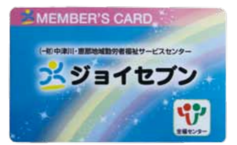
▲ジョイセブンのカード

(一財)中津川・恵那地域勤労者福祉サービスセンター(ジョイセブン)の会員になる事業所を募集します。 ジョイセブンの会員になると、健康診断受診料の助成や慶弔共済給付、チケットのあつせん、各種優待・割引など、福利厚生充実が図れます。