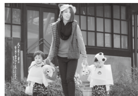
▲仮装をして町内を歩く親子

つきとどんぐり講座 ぎふ木育ひろばとしてどろろ講座を開催します。いろいろな種類のドングリや木について親子で学びましょう。 □とき 10月3日(月)午前10時半～11時半 □ところ こぎつねの森 □締め切り 9月30日(金) 申・問 子育て支援チーム(内線193)