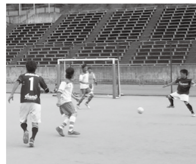
▲熱戦を繰り広げる大会

青空の下、フットサルで汗を流しませんか。 □とき 10月9日(日)午前9時 □ところ 恵那スケート場 □定員 12チーム(先着順) □料金 1000円/チーム □受け付け開始 9月25日(日)午前9時 ☎・☎ 恵那スケート場 ☎28-3390(月曜日休館)