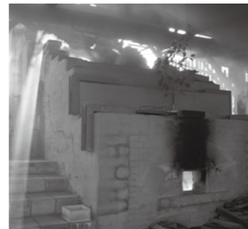
▲焼成後の日の光を浴びる登り窯

登り窯に三日三晩薪をくべ、1230度まで温度を上げていきます。夜の窯たきの炎が見せる姿は圧巻です。年に一度しかできない貴重な体験に参加ください。 □とき 10月8日(土)〜9日(日) ※2日間終日体験できます。参加時間は相談ください □ところ 山岡陶業文化センター □対象 小学3年生以上(小学生の場合は保護者同伴) □定員 20人(先着順) □料金 無料 □服装 綿の長袖シャツ、長ズボン、動きやすい靴 □申し込み方法 電話で申し込み ☎・☎ 山岡陶業文化センター ☎56-4567