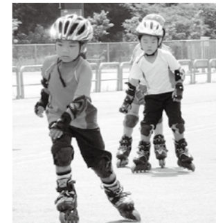
▲さっそうと滑走する

□とき 10月10日(月)午前8時半〜午後5時 □その他 冬季営業は11月27日(日)から開始します。それまでの間も、トレーニングルームと会議室は利用できます。 □恵那スケート場 28-3390(月曜日休館)