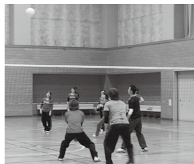
▲職場の仲間と楽しく行う

フォトロゲイニングとは、チェックポイントを写真撮影して得点を多く得る、誰もが楽しめるスポーツです。地図とコンパスを持って明智町の町中や山地に設定された約30カ所のチェックポイントを制限時間(3時間)内にできるだけ多く回ります。 □とき 10月30日(日)午前8時半 □ところ 明智小学校 □料金 ▼高校生以上1300円 ▼中学生以下1100円