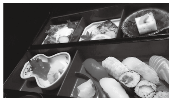
▲プロにすしの握り方を習い、御膳と共に味わう

㉜大井宿旅館「角屋」でマクロビランチ ▽とき11月10日(休)午前11時半 ▽ところ旅館いち川