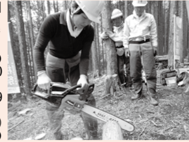
▲チェーンソーで木を切る実習

安全・安心が最優先の山仕事について学べる「山しごと手習い塾」を開催します。山の見方や手入れの仕方が分かり、チェーンソーの基礎知識も学べる実践講座です。山仕事に興味がある方は、この機会にぜひ、参加ください。