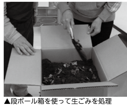
▲段ボール箱を使って生ごみを処理

ダンボールコンポスト講座、30リットルの段ボール箱で、約3カ月分の生ごみを処理できます。臭いや汁漏れの心配が無く軽いので、ごみ出しが楽になります。