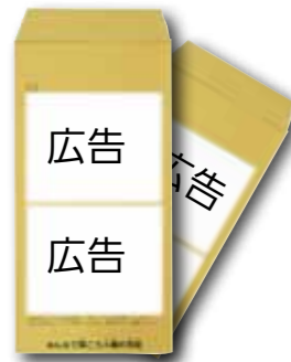
▲広告位置のイメージ