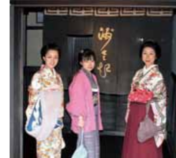
▲着物で城下町を巡る催しも

年3月31日(金) □その他 詳しい内容や申し込みについては、「いわむら五つこ」特設ウェブサイト