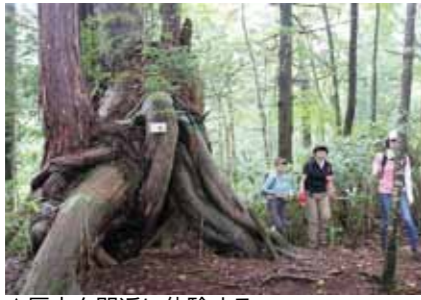
▲巨木を間近に体験する

NPO法人福寿の里自然倶楽部では、自然体験ツアー参加者を募集します。 珍しい共生木や根上がり木を巡る原生林トレッキングツアーで、樹齢2千年の弁慶杉を訪ねるコースです。そこに居るだけで心と体が癒やされる神秘的な自然と森を体感しませんか。 □とき 10月16日(日)、11月3日(木) ※希望口を選んで申し込みください □定員 各20人(先着順) □料金 2500円(入山料、保険料、ガイド料を含む)