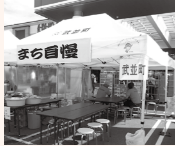
▲イベント用テント