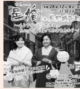
▲城下町で婚活しませんか