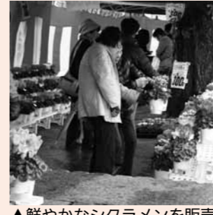
▲鮮やかなシクラメンを販売