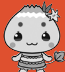
市公式キャラクター「エーナ」