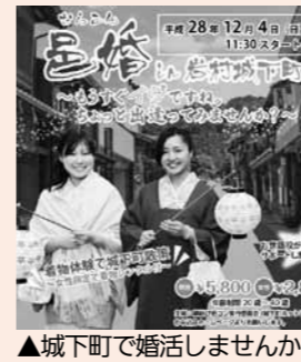
▲城下町で婚活しませんか