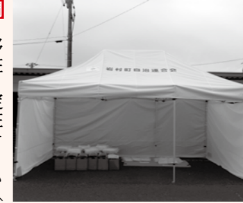
☎ 移住・定住チーム(内線523) ▲イベント用テント

岩村町自治連合会では、宝くじの助成金を活用してイベント用の活動備品(テントとテーブル、椅子)を整備しました。宝くじ事業は、一般財団法人自治総合センターが宝くじの社会貢献広報事業として宝くじの受託事業収入を財源として行われているもので、地域のコミュニティ活動の充実や強化を目的としています。整備された備品は各種