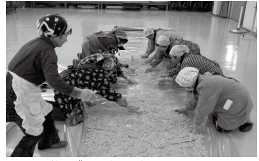
▲器具を使わず足で踏んで大豆をつぶす

□提出書類 非常勤職員等登録申込書、作文 □締め切り 2月3日(金) 総務課(内線459) ☎・☎ 恵那みそ寒仕込み講座の受講生 恵那産の大豆と恵那のおいしい水を使い、無添加で無香料のみそ造りを行う講座の受講生を募集します。 講座では、恵那みそを製造販売している農業女性グループ「むつみマニユファクトリー」のメンバーが講師となり、みそ造りを指導します。2月に仕込み、12月に蔵出し作業を行います。 □とき 2月16日(木)午後1時半