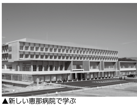
▲新しい恵那病院で学ぶ

□料金 無料 □申し込み方法 直接か電話で申し込む ※「水中運動教室」は本人が申し込んでください。各教室とも、定員になり次第締め切ります。1人で複数人の申し込みはできません。申し込み後の開催通知はしませんので、了承ください □受け付け開始 1月26日(木)午前10時 ※水中運動教室(水曜日昼)は1月27日(金)午前10時 □施設利用料 一般300円/回、小中学生150円/回