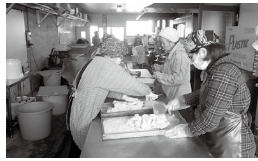
▲講師の指導の下、みそを造る

市では平成29年4月任用予定の非常勤職員を募集します。 □募集職種 事務職員、労務職員、保育教諭、保健師、介護員、看護師、図書館司書、各種相談員、バス運転手など □業務内容 1週間の勤務時間は37・5時間で補助的業務や補完的業務などに従事 □任用期間 原則1年 □募集人数 250人程度 □申し込み方法 総務課(西庁舎4階)や各振興事務所に備え付けの募集要項を確認の上、勤務を希望する職場へ申し込む ※募集要項は市ウェブサイト( http://www.city.ena.lg.jp )でも取得できます