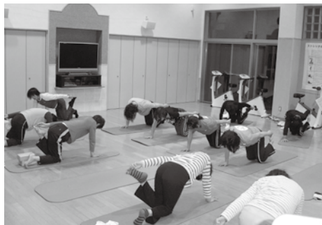
▲ヨガで体リフレッシュ

各種教室の参加者を募集 らっぽ(楽歩)では、生活習慣病の予防や健康づくりのために、初心者でも簡単に取り組める各種運動教室を開催しています。 気に入った教室や自分に合った教室を選んで、気軽に参加してください。 体リフレッシュヨガ教室 □とき 2月7日、14日、28日、3月14日、28日(毎週火曜日)午後1時半〜3時、2月23日、3月9日、23日(毎週木曜日)午前10時半〜正午