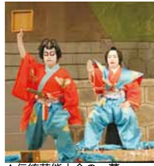
▲伝統芸能大会の一幕

今年で27回目となる市伝統芸能大会を開催します。今回のテーマは「伝えよう 活かそう 恵那の伝統芸能」。歌舞伎や文楽、獅子舞など、市内各地に古くから伝わる芸能を一堂に会し、披露します。花道展示や呈茶、地域特産品の販売コーナー、市歴史刊行物販売、浮世絵版画重ね摺り体験もあります。ステージでは太神楽曲芸アトラクションを午後1時20分(予定)から行います。この機会に地域特有の伝統芸能の魅力を再発見してください。