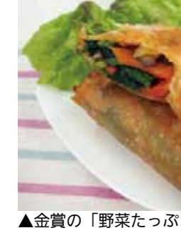
▲金賞の「野菜たっぷり春巻き」