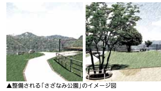
▲整備される「さざなみ公園」のイメージ図

峡さくら名所づくり事業」で市民による桜の植樹をしましたが、30年以上がたち、公園全体で衰弱した木々が目立ち始め、枯れ枝が落ちるなどの危険があることから、間伐と剪定をすることにしました。