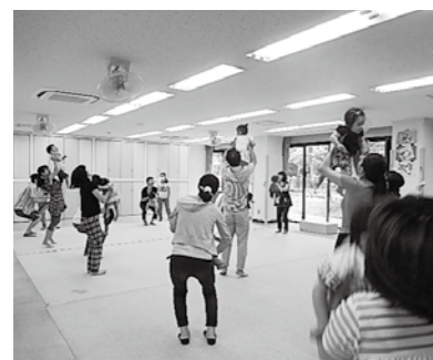
▲親子で触れ合い遊びをする

案 内 子ども元氣プラザのイベント みんな集まれ! 人形劇を見たり、みんなで歌ったりして楽しい時間を過ごしましょう。 □とき 3月14日(火)午前10時20分~11時 □ところ こども元氣プラザ □内容 触れ合い遊びと親子体操、人形劇サークル「ピエロ」による人形劇 □対象 市内在住の未就園児の親子 ※申し込みは不要 ☎ こども元氣プラザ ☎25-1155