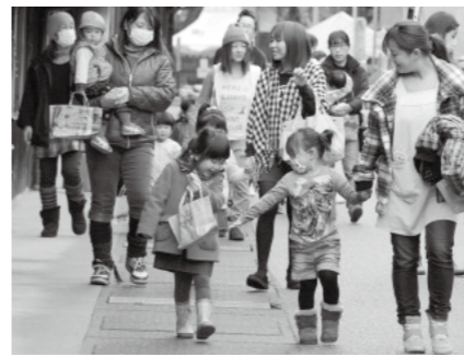
▲おひなさまを見ながら散歩する

昔からおひなさまが飾られる時期になると、子どもたちが「おひなさまを見せて」と家々を回り、お菓子をもろう風習があります。岩村城下町の町並みに飾ってあるおひなさまを見学しながら、みんな楽しく散歩しませんか。