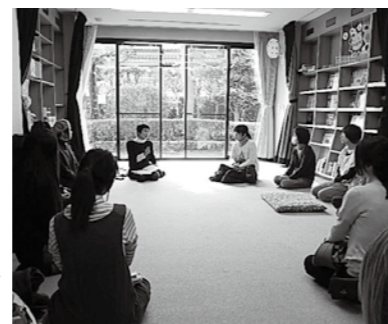
▲みんなで先生の話聞く

案 内 子ども元氣プラザのイベント みんな集まれ! 人形劇を見たり、みんなで歌ったりして楽しい時間を過ごしましょう。 □とき 3月14日(火)午前10時20分~11時 □ところ こども元氣プラザ □内容 触れ合い遊びと親子体操、人形劇サークル「ピエロ」による人形劇 □対象 市内在住の未就園児の親子 ※申し込みは不要 ☎ こども元氣プラザ ☎25-1155