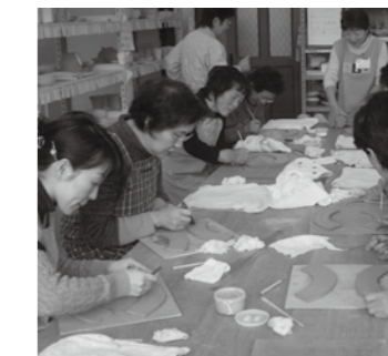
▲みんなで楽しく作陶する

案内 山岡陶業文化センター 年間の教室開催予定 平成29年度に山岡陶業文化センターで開催する特別教室のお知らせです。各教室とも講師が丁寧に指導します。特別教室以外にも、年間を通して陶芸教室を開催しているのので、ぜひ参加ください。なお内容は変更になる場合があります。