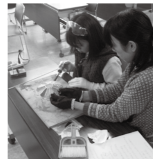
▲親子で市民講座を受講する

募集 掛け花入れ作りの参加者 陶器の掛け花入れで、家の壁をすてきに演出してみませんか。手作りの器で野に咲く花や枝がおしゃれに変身。初めての方や高齢の方でも、講師が丁寧に指導しますので気軽に参加ください。 □とき 4月16日(日) 午前10時~正午 ②午後1時半~3時半 □ところ 山岡陶業文化センター □定員 各15人(先着順) □料金 1500円 □持ち物 エプロン、タオル