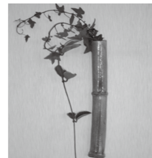
▲竹を模したおしゃれな作品

募集 掛け花入れ作りの参加者 陶器の掛け花入れで、家の壁をすてきに演出してみませんか。手作りの器で野に咲く花や枝がおしゃれに変身。初めての方や高齢の方でも、講師が丁寧に指導しますので気軽に参加ください。 □とき 4月16日(日) 午前10時~正午 ②午後1時半~3時半 □ところ 山岡陶業文化センター □定員 各15人(先着順) □料金 1500円 □持ち物 エプロン、タオル