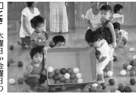
▲仲良くみんなでボール遊びをする

こぎつねの森の横にある畑で、本格的な土作りから始めて野菜作りを学びます。季節の野菜の種や苗を植え、手入れをして収穫します。子どもと一緒に安心安全な野菜を育てていきましょう。 □とき 4月26日(水)午前10時半～11時半 □ところ こぎつねの森 □料金 無料 □その他 この日はこぎつねの森横の駐車場は作業場所確保のため駐車禁止とします。 共通 □対象 未就園児の親子 □施設使用料 無料 □その他 こぎつねくんわーいなどの会員に登録される方の費用は1000円/年(特典あり) □申込 NPO法人こぎつねくんわーい ☎ 32-1112 1(月)・水・金曜日午前10時～午後3時