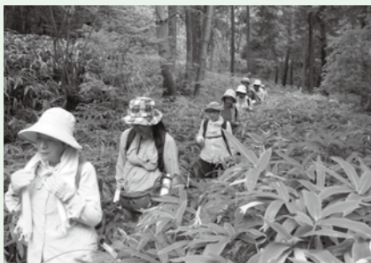
▲大自然の中を仲間と歩く